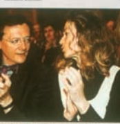
ENFANGSCHÜSSEL „Aber, wenn er sich mit Haider einigt“

Bei der gemeinsamen Pressekonferenz von Schüssel und Haider am Dienstag vergangenen Woche gab der Kanzler seinen neuen Kampagnen sogar in aller Öffentlichkeit rituelle Anweisungen.