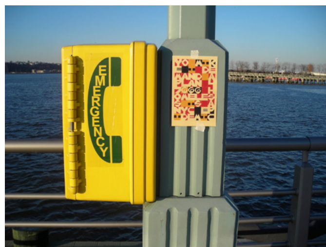
Postcards posted , 2013, New York, document photographique / photographic document; PAGE 50 : blog as studio artist as circulator , 2012, encre sur papier / ink on paper, 18 x 13 cm

nos sociétés, rendant tangible le flux constant entre la constitution d'un espace privé domestique et celle d'un espace public politique, entre la constitution du Soi et l'identification de l'Autre. L'artiste, créant elle-même ses cartes postales en partant de ses explorations typographiques, renverse la tendance à l'idéalisation, la réinvestit d'un autre pouvoir qui est moins celui du contrôle idéologique d'un espace que celui de l'échange potentiel.