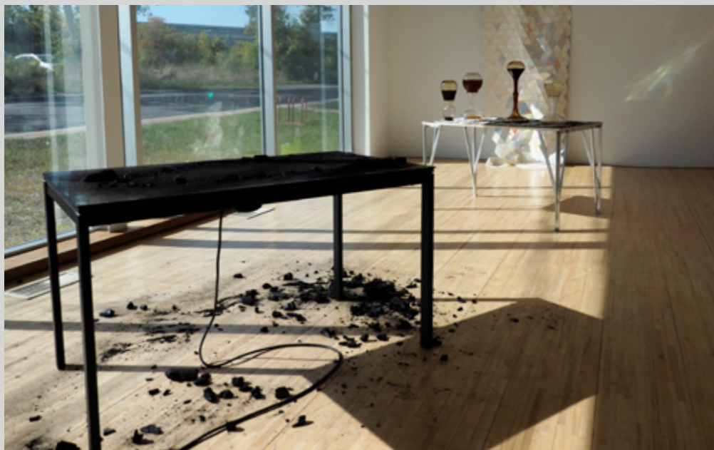
Au premier plan : Alexis Bellavance, Table préparée n° 2 (détail), 2019, en arrière-plan : Sarah Wendt & Pascal Dufaux, Sabliers de miel (détail), 2019

photographies – des écrits de lumière. Être au cœur de la camera obscura , c’est devenir le témoin privilégié de l’origine d’une image. C’est être du côté de sa fabrication, de son arrivée et de sa présence au monde. C’est observer l’image avant même qu’elle n’existe : être l’œil au seuil du visible. Le phénomène optique qui a cours ici est précisément ce qui se produit à l’intérieur du dispositif