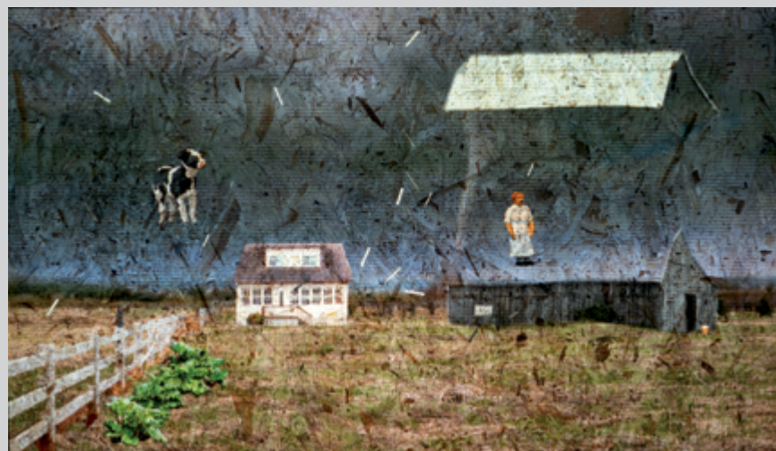
Se faire emporter par le vent, 2019, projection vidéo sur panneau de copeaux de bois, 3 min

Une question spécifique, liée à cette « création du réel », semble chère à l'artiste : celle de la construction de l'authenticité. La chanson qui emplit l'espace, imposant son rythme lancinant à l'ensemble de l'exposition, nous met sur cette piste. Elle provient de la deuxième œuvre clé : une installation vidéo constituée de trois projections où l'on voit respectivement l'artiste, sa mère et sa sœur qui entonnent T'envoler , une pièce western de Paul Daraïche. Le fait que les trois chanteuses tournent fantastiquement sur elles-mêmes, perdues dans un fond noir, rappelle le motif de l'ouragan. Et la présence du mot « envoler », ici utilisé de façon figurée (puisque'il s'agit d'un amour perdu), fait écho à l'histoire d'Alice. Mais c'est la