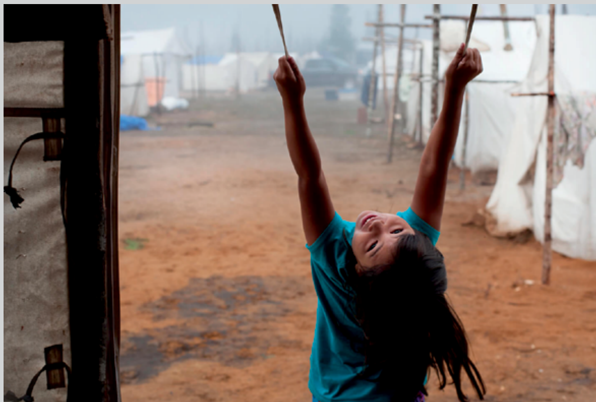
Sheshatshit , 2017, impression numérique, 40 x 60 cm

Indian Time , c'est le temps d'une rencontre. Celle d'Elena Perlino, photographe italienne basée en France, avec les communautés innues et naskapiés situées entre Natashquan, Mani-Utenam, Matimékush-Lac-John, Kawawachikamach et Sheshatshiu. Issus des différents séjours réalisés dans la région en 2017 et 2018, les clichés d'Elena Perlino ont été exposés à la Maison de la culture du Plateau Mont-Royal du 2 novembre au 2 décembre 2018. Une publication qui réunit l'ensemble du travail photographique est en cours de préparation, grâce aussi à la contribution de l'Institut italien de culture de Montréal qui a soutenu le projet dès ses débuts.