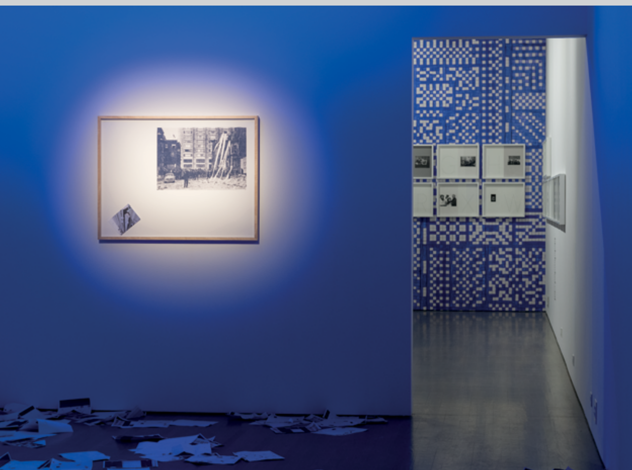
Blues Klair , vue de l'exposition à la galerie Leonard & Bina Ellen, photo : Paul Litherland/Studio Lux