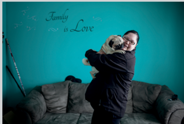
Family is love , Schefferville, 2017, impression numérique, 40 × 60 cm