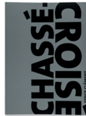
Chassé-croisé , Montréal, mai 50 2015, leporello, 68 pages 41 photographies / 41 photographs