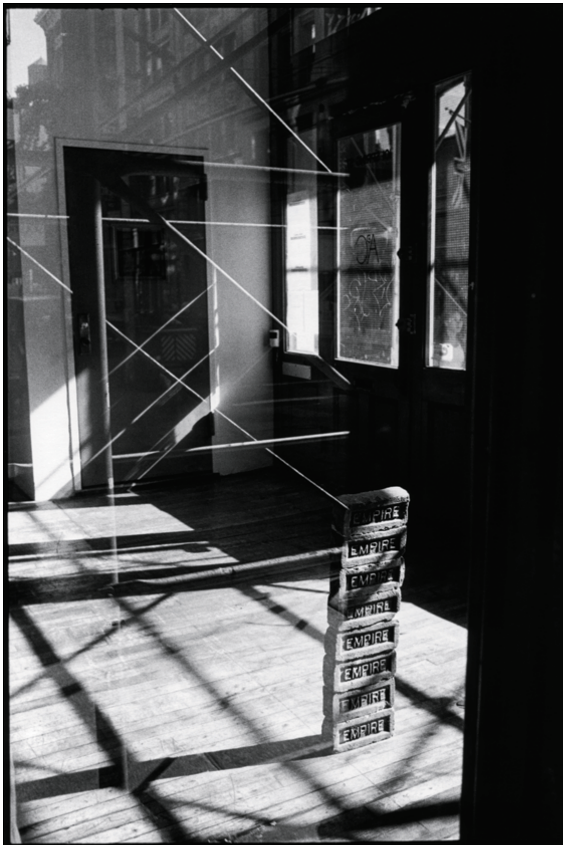
Bond – New York, NY, USA, 2007 Bus – Montréal, Québec, 2003 Empire – New York, NY, USA, 2007 de la série / from the series NAY, 2007, épreuves argentiques / gelatin silver prints, 100 × 67 cm