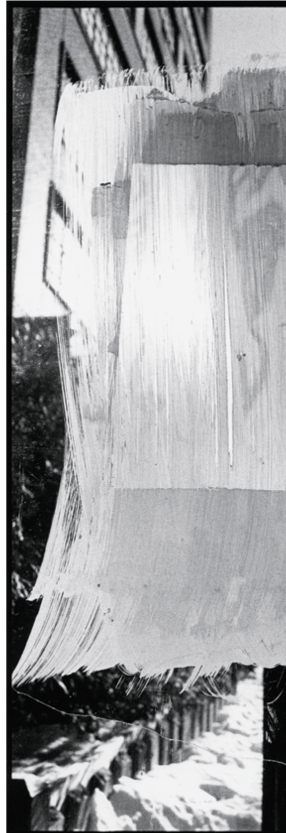
Scotch – Montréal, Québec, 2003 Voile – Montréal, Québec, 2001 Restes – Paris, France, 1998 de la série / from the series Courants – contre-courants, 2007 épreuves argentiques / gelatin silver prints 100 × 67 cm