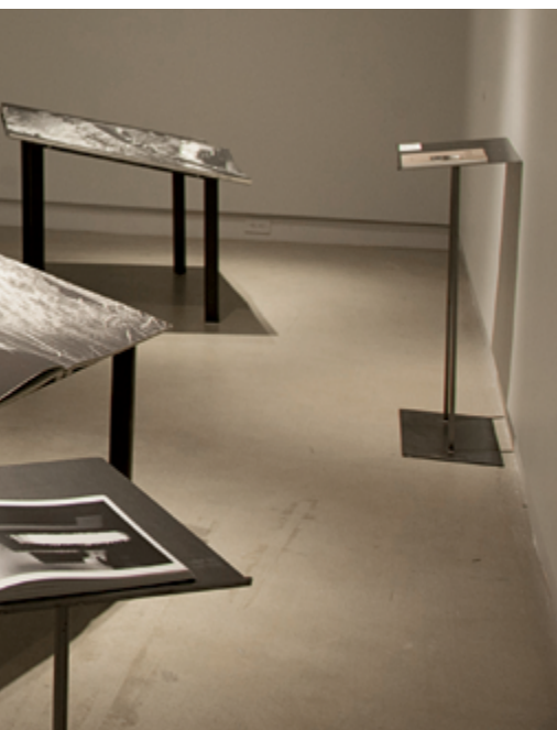
Archipel, vues d'installation / installations view, galerie Occurrence