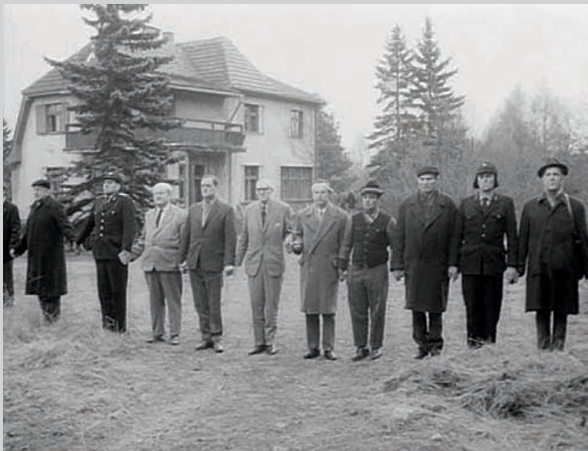
Jan Švankmajer, Zahrada / The Garden , 1968, image fixe, film 35 mm (sur Blu-ray), noir et blanc, son, 16 minutes, permission d'Athamor Film Production Company Ltd.

VOX proposait aussi trois courts métrages du cinéaste tchèque Jan Švankmajer reconnu pour ses films d'inspiration surréaliste, sortes de cauchemars résultant de l'anéantissement de la tentative d'implantation d'un socialisme à visage humain en Tchécoslovaquie lors du Printemps de Prague. Zahrada (1968) raconte la visite qu'un individu fait de la demeure d'un ami dont la clôture est composée de différentes personnes se tenant la main. Après avoir appris les raisons de ce curieux assemblage, celui-ci décidera de prendre place parmi les gens formant ce mur d'enceinte. Dans Byt (1968), un homme constate, après avoir été projeté dans une pièce, qu'il ne s'agit pas d'un appartement ordinaire. Peu à peu, les objets s'animent et s'en prennent à lui, l'empêchant de s'évader de cette prison. Enfin, dans Do pivnice (1982), une jeune fille doit descendre dans une cave, lieu lugubre occupé par d'étranges personnages et dans lequel les objets sont vivants et agressifs, pour aller chercher des pommes de terre qui lui résistent, tout en affrontant un maléfique chat noir.