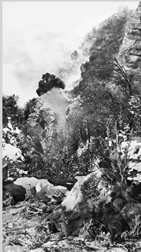
Ascent to the Edge , 2011, épreuve argentique, 160 × 90 cm, permission de la galerie Art Mûr