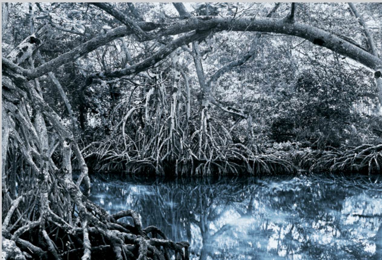
Heavenly Invitation , 2009, épreuve couleur montée sur Dibond, 120 × 180 cm

Elle ne nous laisse pas pour autant oublier qu'il s'agit d'une nature construite par l'appareil photographique, comme plus généralement le paysage peut l'être par le regard esthétique qui le met à distance dans un cadre. Quoi de plus naturel que d'apprivoiser le sublime insaisissable des immensités extérieures en faisant percevoir en même temps sa continuité avec l'espace intime des rêveries suggérées par des objets minuscules ? Les enfants ne s'y trompent pas, et ont raffolé de l'activité préparée à leur intention par le musée de Sherbrooke dans une salle attenante : la fabrication de petits paysages à