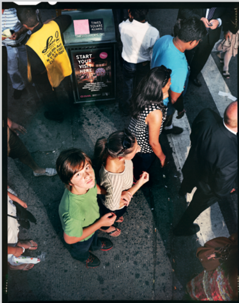
Ethan Levitas, Frame 21, Photographs in 3 Acts , 2012, permission de la galerie Jean-Kenta Gauthier, Paris

Il fallait être doté d'un esprit boulimique pour s'attaquer à la 47 e édition des Rencontres d'Arles. Cette année encore, le festival proposait pour sa semaine d'ouverture et durant tout l'été de quoi boire et manger plus qu'à satiété (une quarantaine d'expositions, sans compter les événements du off et toutes les animations parallèles, comme le salon du livre photographique Cosmos Arles Books et le VR Arles festival, premier festival artistique consacré à la réalité virtuelle). Dédiée à l'écrivain Michel Tournier (cofondateur des Rencontres en 1970, disparu au début de l'année), cette édition avait pour vocation de satisfaire un public le plus large possible, en présentant toutes les tendances, de la photographie documentaire et de reportage (Grossman, McCullin ou Morvan) à des pratiques plus conceptuelles et expérimentales (Boyle, Abril ou Marclay). Une programmation annoncée par son directeur, Sam Stourdzé, comme une « radioscopie de la création contemporaine » qui reflétait, en somme, un désir d'exhaustivité visant