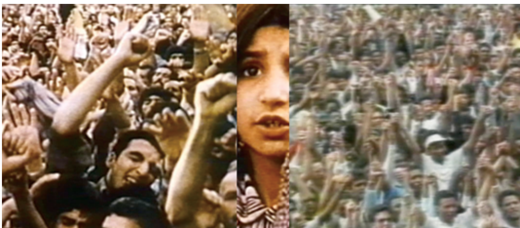
Dominique Blain Émergence , 2015 installation vidéo, en boucle, avec son / video installation, loop, sound, 4 min 30 s, 2 écrans (projection avant) / 2 screens (frontal projection), 244 x 270 cm, et / and 1 écran (projection arrière) / 1 screen (rear projection), 244 x 325 cm, avec la permission de la / courtesy of galerie antoine ertaskiran, Montréal