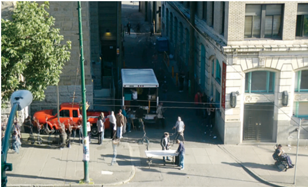
Paul Wong Solstice , 2014 arrêt sur image, installation vidéo / still of video installation, 24 min 18 s couleur / colour, stéréo / stereo