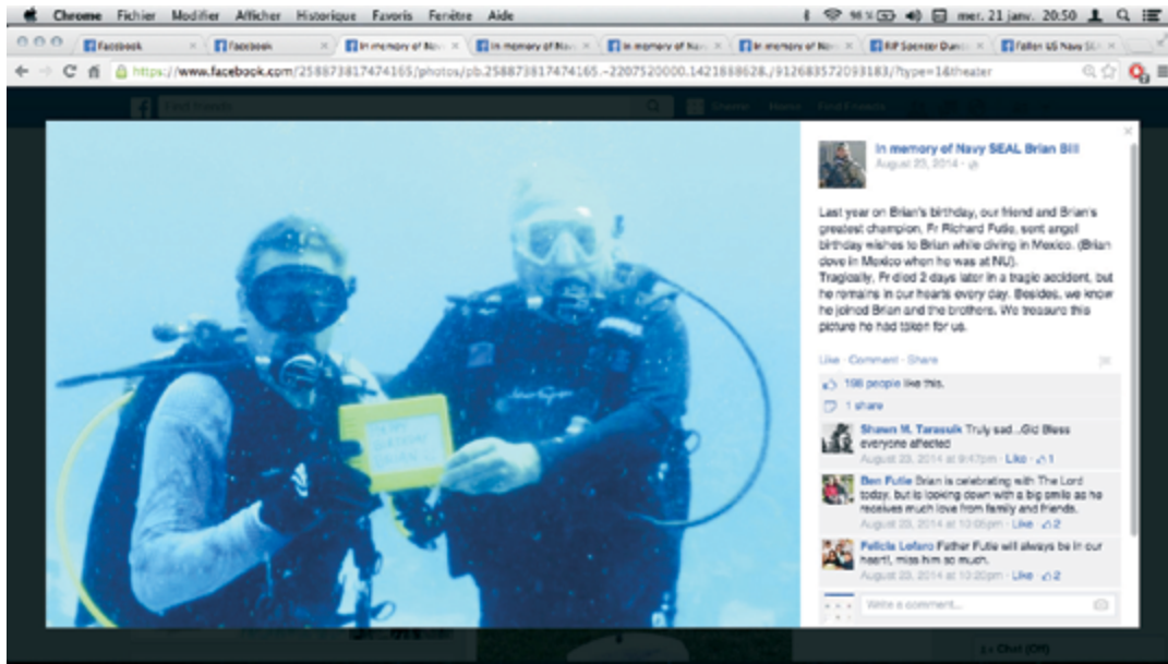
After FaceBook AFTER FACEBOOK: IN LOVING MEMORY <3, 2015 (détail / detail) capture d'écran, image numérique / screen capture, digital image