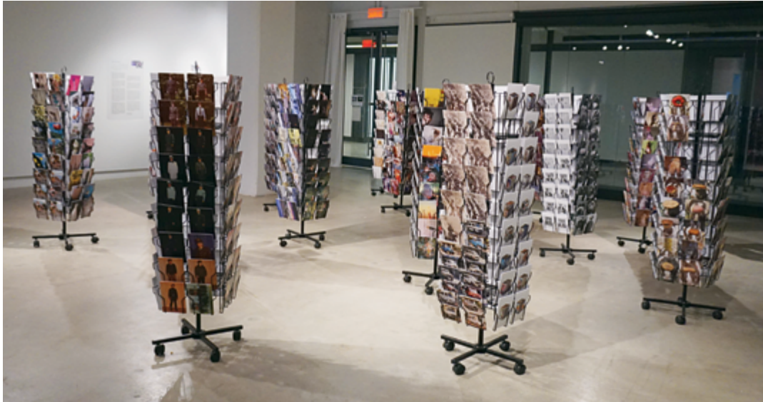
Erik Kessels All Yours , 2015 vue d'exposition / exhibition view, cartes postales extraites de précédentes publications de l'artiste faites d'images trouvées / postcards from previous publications by the artist made of found images