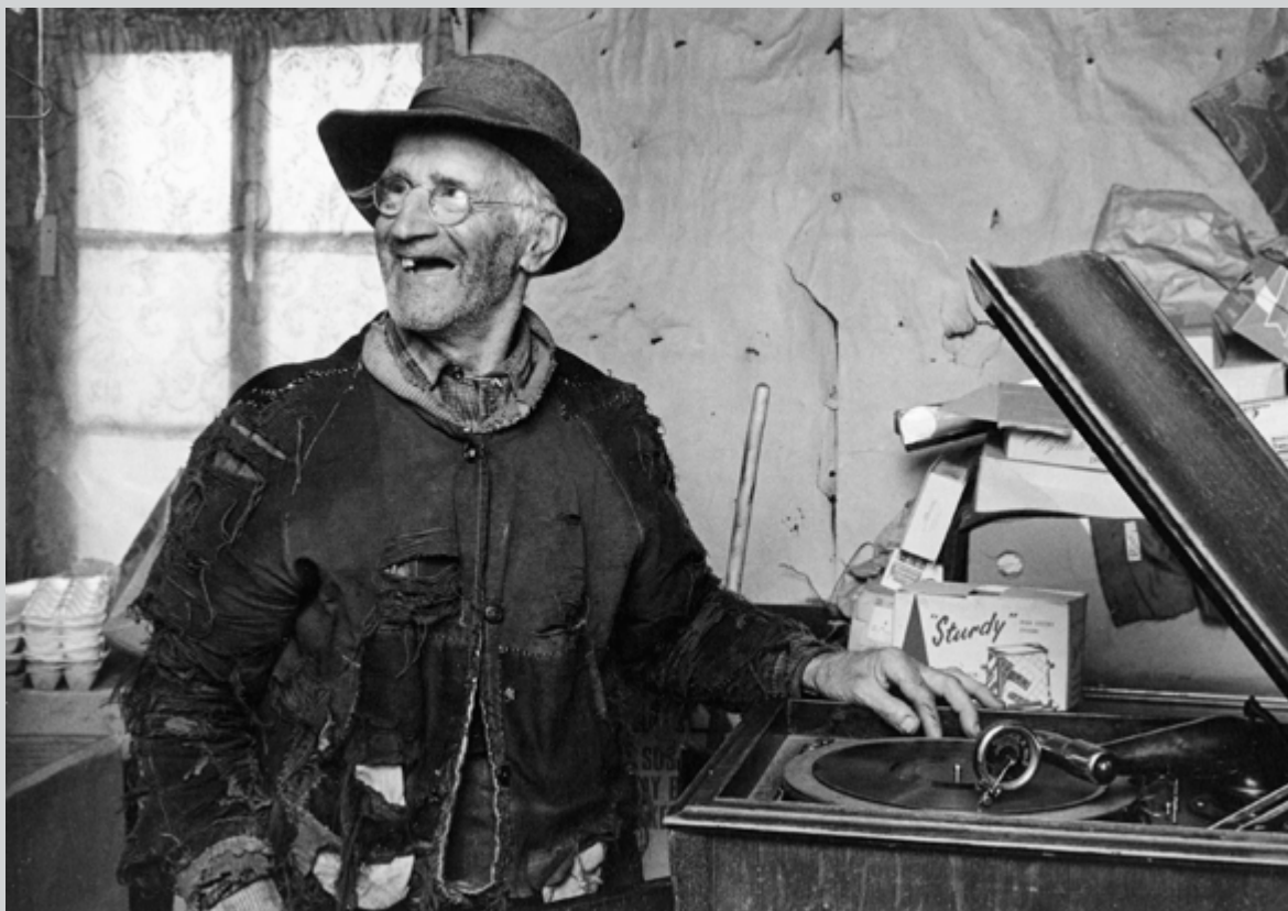
Un homme et son gramophone, Senneville , 1976

Beaugrand-Champagne prolonge son projet en s'attachant, à son retour, à la vie de deux familles vietnamiennes rencontrées au Cambodge et qui ont immigré au Québec. Pendant plus de 15 ans, elle suivra ces nouveaux arrivants dans leur apprentissage de la vie dans la société québécoise. Ces images de petit format présentées en vitrine