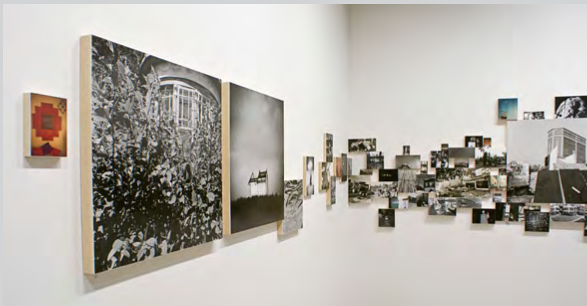
Vue d'exposition de Visites libres , 2013, épreuves argentiques et tirages au jet d'encre

Visites libres présente le (les ?) regard(s) que pose Yan Giguère sur la notion d'habitat. Sur ses significations, ses implications, ses occupants, que ceux-ci soient