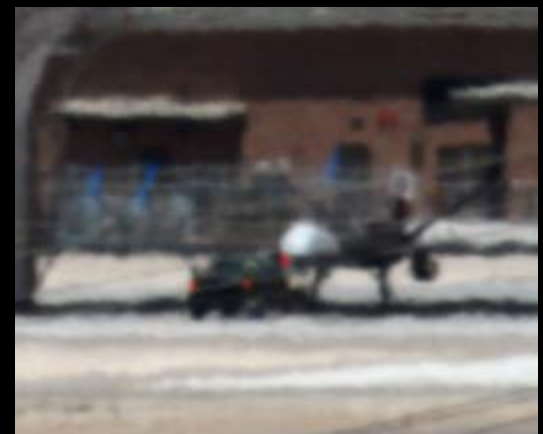
Trevor Paglen, Reaper Drone: Indian Springs, NV; Distance - 2 miles , 2010, c-print / épreuve chromogénique, 76 x 91 cm