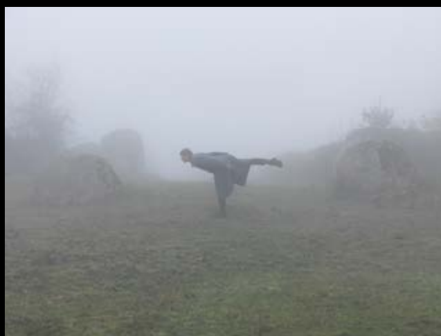
Elina Brotherus, Nu aux bottes de randonnée , from the series / de la série 12 ans après , 1999–2012, pigment ink print on Fine Art Baryta rag paper / épreuve à jet d'encre à pigments sur papier chiffon baryté beaux-arts, 90 x 110 cm; Exercice d'équilibre , 2011, from the series / de la série 12 ans après , 1999–2012, 90 x 120 cm ea. / ch.