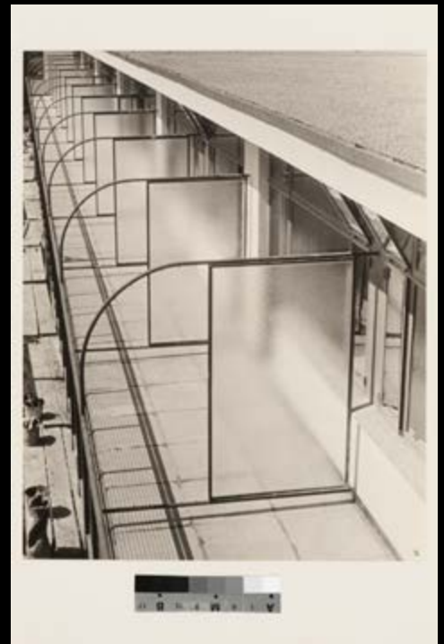
Ilse Bing , View of the glass partitions on the balconies of the Budge Foundation Old People's Home, Frankfurt am Main, Germany, 1930 , gelatin silver print / épreuve argentique à la gélatine, 28 x 22 cm, CCA Collection, courtesy of the / permission du CCA © Estate of / Succession Ilse Bing