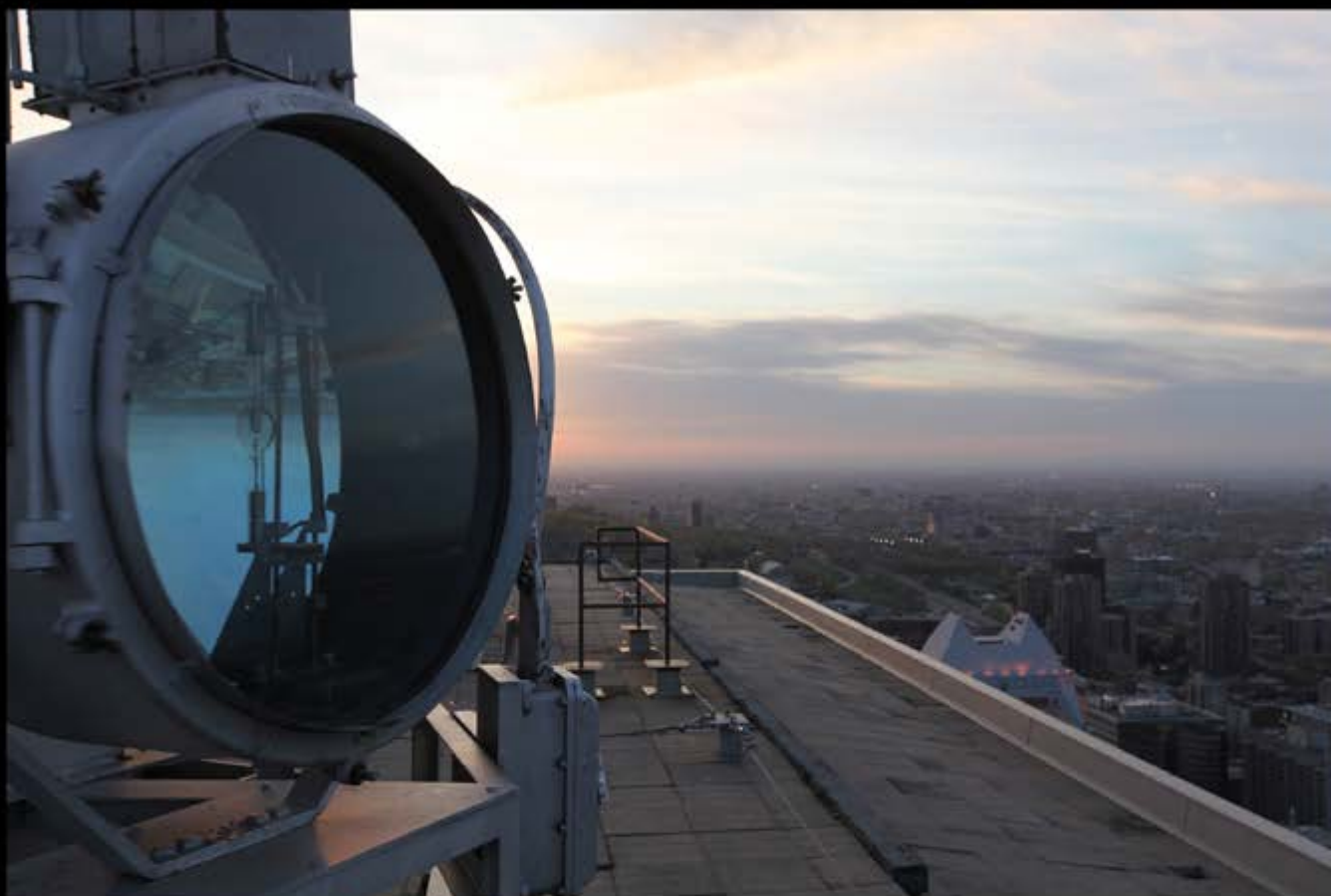
David K. Ross, Le Phare , 2012, 16 mm film transfer to 2K, 13 min 20 s, colour, sound Dolby 5.1, loop / film 16 mm transféré en 2K, 13 min 20 s, couleur, son Dolby 5.1., en boucle