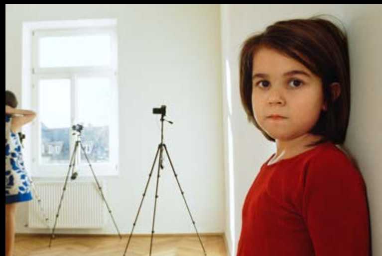
Barbara Probst, Exposure #55: Munich, Waisenhausstrasse 65, 01.17.08, 1:55 p.m. , 2008, images from the work / images tirées de l'œuvre, Ultrachrome ink on cotton paper / encre Ultrachrome sur papier de coton, 75 x 112 cm ea. / ch. (12)