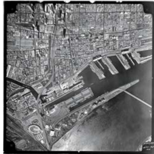
Mishka Henner , NATO Storage Annex, Coevorden, Drenthe , 2011, from the series / de la série Dutch Landscapes (2011), archival inkjet print / épreuve à jet d'encre sur papier archive, 50 x 56 cm; The Bonaventure Expressway and University Street / l'autoroute Bonaventure et la rue University, Montreal, aerial view / vue aérienne , 1968, positive on glass / positif sur verre, 24 x 24 cm

in human perception, Drone: The Automated Image was a compelling demonstration of how the history of photography should be rethought.