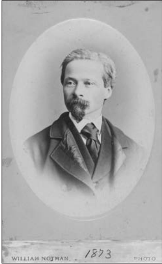
Napoléon Bourassa, 1873. Photo de William Notman. Carte de visite, épreuve à l'albumine argentique, 9,1 x 6,1 cm (image), 10,2 x 6,3 cm (carte).

Source : MNBAQ, fonds Jeanne-Bourassa, album de la famille Bourassa, B-7. Don en 2010