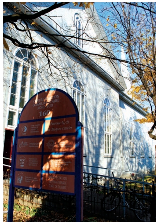
Des ateliers d'artistes et des organismes communautaires logent dans les jubés et les bas-côtés de l'église Notre-Dame-de-Jacques-Cartier.