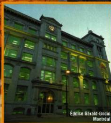
Édifice Gérard-Godin Montréal