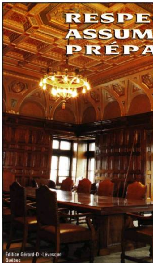
Édifice Gérard-D.-Lévesque Québec