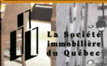
La Société immobilière du Québec