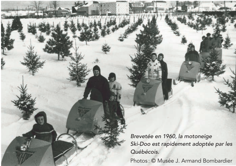
Brevetée en 1960, la motoneige Ski-Doo est rapidement adoptée par les Québécois.