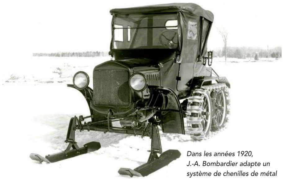
Dans les années 1920, J.-A. Bombardier adapte un système de chenilles de métal à une Ford modèle T.

Son besoin inné de concevoir et d'inventer, combiné aux avancées techniques de l'époque, l'amène à créer des véhicules plus petits et moins lourds. Il réalise différents