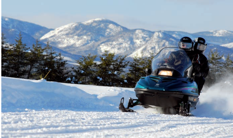
La pratique de la motoneige est entrée dans les mœurs québécoises : 33 000 kilomètres de sentiers balisés donnent accès à de magnifiques paysages.

prototypes et, dès l'hiver 1959, la première motoneige Ski-Doo est fabriquée à la main en deux exemplaires. C'est un petit véhicule récréatif rapide, léger, économique et facilement manœuvrable. Considéré comme le père de la motoneige, Joseph-Armand Bombardier est le premier à la produire en série et à la commercialiser. Brevetée en 1960, la motoneige Ski-Doo est d'abord commercialisée auprès des personnes appelées à se déplacer l'hiver dans les régions isolées : missionnaires, trappeurs, prospecteurs, arpenteurs. Elle transforme le mode de vie des populations du Grand Nord et révolutionne le transport hivernal dans les régions éloignées. Munie de skis de bois, d'une chenille sans fin tout caoutchouc et propulsée par un moteur léger à quatre temps monté à l'avant, la motoneige donne naissance à un nouveau sport et fait rapidement partie des loisirs des Québécois. À preuve, dès les années 1960, sa mise en marché entraîne des retombées économiques de plusieurs centaines de millions de dollars. Entre 1970 et 1973, plus d'une centaine de fabricants produisent près de 500 000 unités annuellement.