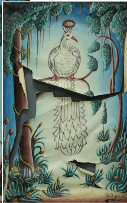
Plusieurs œuvres ont été endommagées lors du séisme du 12 janvier 2010 en Haïti. Ici, un tableau de Bourmond Byron, avant et après sa restauration.