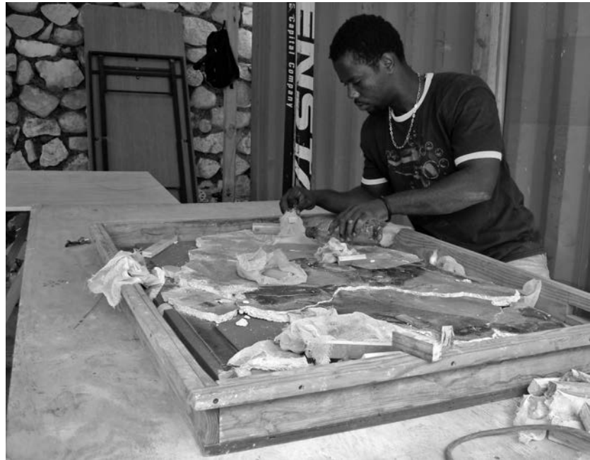
Après avoir été formé par une restauratrice de murales, un des assistants du Centre de sauvetage des biens culturels travaille à la consolidation et au nettoyage d'un morceau de murale de la cathédrale Sainte-Trinité.

Un pan important de la mission du CSBC consistait à sensibiliser et à former les intervenants culturels haïtiens en conservation préventive: employés de galeries d'art ou de musées, particuliers possédant des collections, étudiants en muséologie, artistes, etc. Des restaurateurs et diverses organisations, comme le Centre international d'études pour la conservation et la restauration des biens culturels (ICCROM), ont donné des formations sur une foule de sujets: conservation préventive