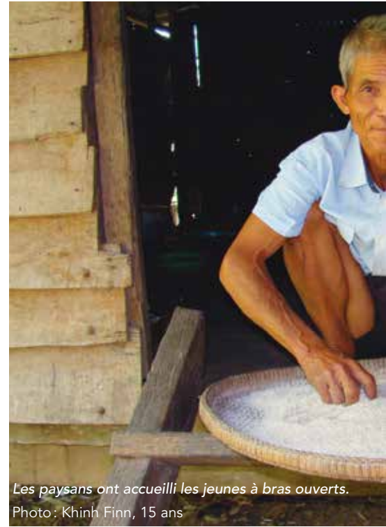
Les paysans ont accueilli les jeunes à bras ouverts.

La coopération internationale prend toutes sortes de formes. À preuve, une initiative de l'Association Québec-Cambodge a permis d'éveiller les jeunes d'Angkor à la richesse de leur patrimoine.