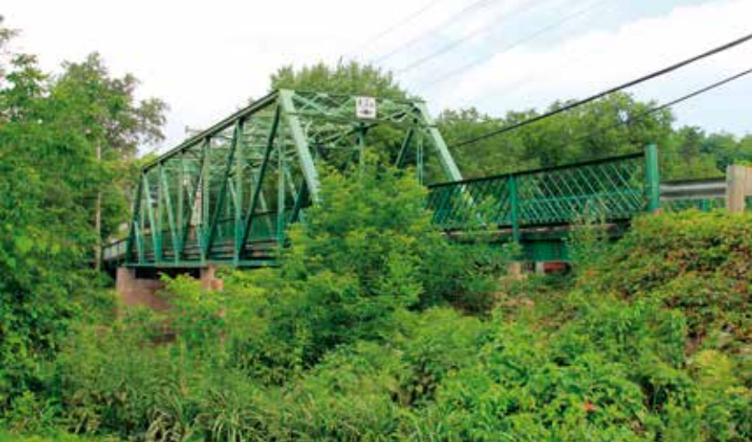
Dans un environnement naturel intéressant à Mirabel, dans les Laurentides, le pont dit « Mackenzie » et ses abords pourraient être mis en valeur.

les ponts) ont littéralement créé le paysage, puisque leur construction a ouvert de nouvelles perspectives sur le territoire.