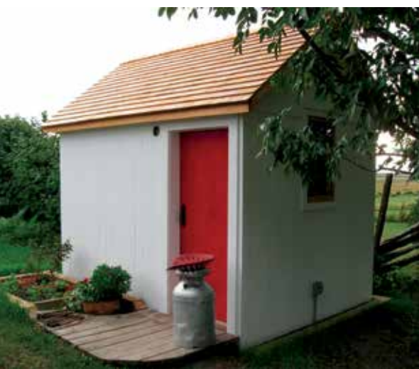
Laiterie de Réjean Bernier à Rivière-Ouelle (vers 1916)

Soigner les animaux et entreposer est la catégorie qui compte le plus de types de bâtiments: granges-étables, hangars à grain, porcheries, poulaillers, écuries, hangars à bois. Dans le Kamouraska, on trouve