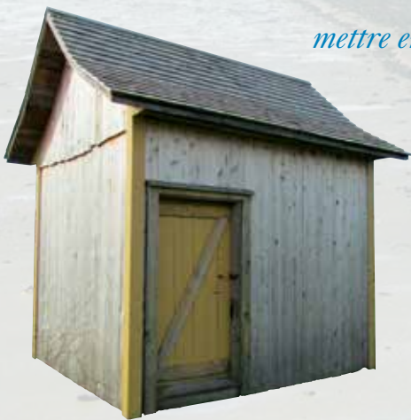
Laiterie datant de 1875 à Saint-André

L'inventaire des petits patrimoines, choisis en fonction de leur représentation dans le milieu et dans l'histoire des municipalités, a permis d'identifier les formes courantes