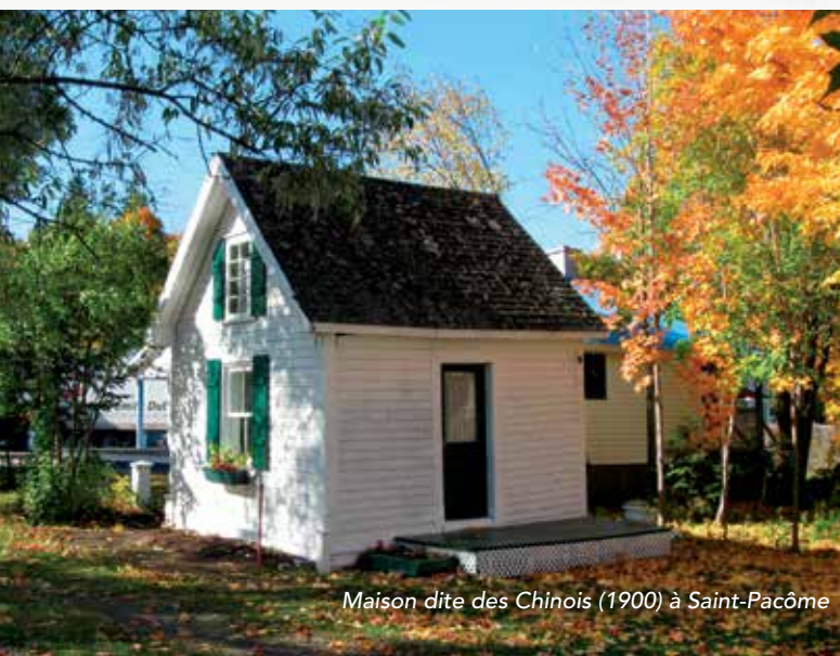
Maison dite des Chinois (1900) à Saint-Pacôme