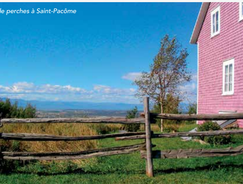
le perches à Saint-Pacôme