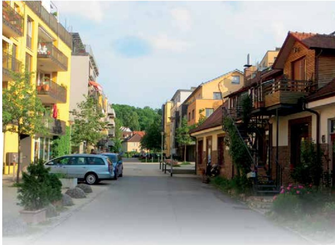
Les dépendances du quartier Loretto (à droite) ont été recyclées et intégrées à un cadre bâti résolument contemporain.

Enfin, ces quartiers font la part belle à la nature. Par exemple, les ruisseaux canali-