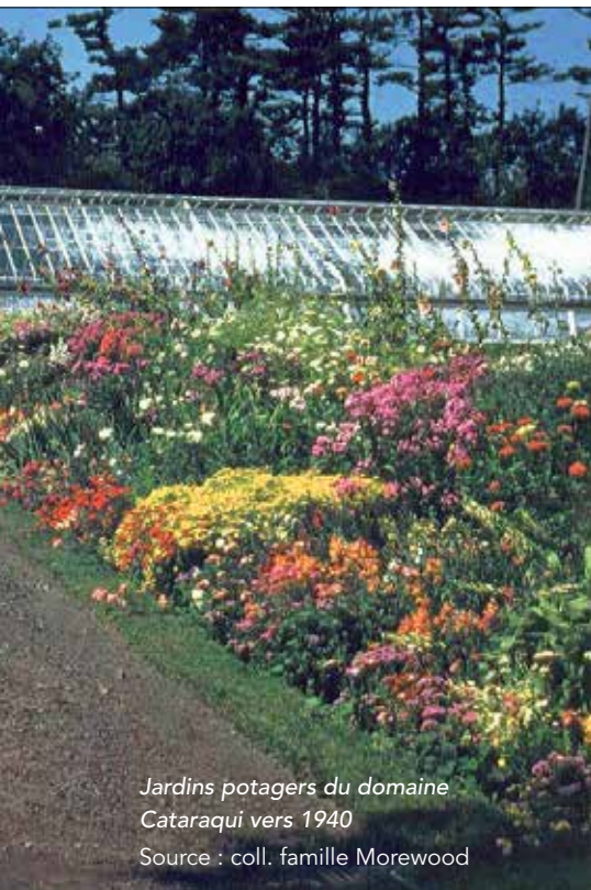
Jardins potagers du domaine Catarauqui vers 1940