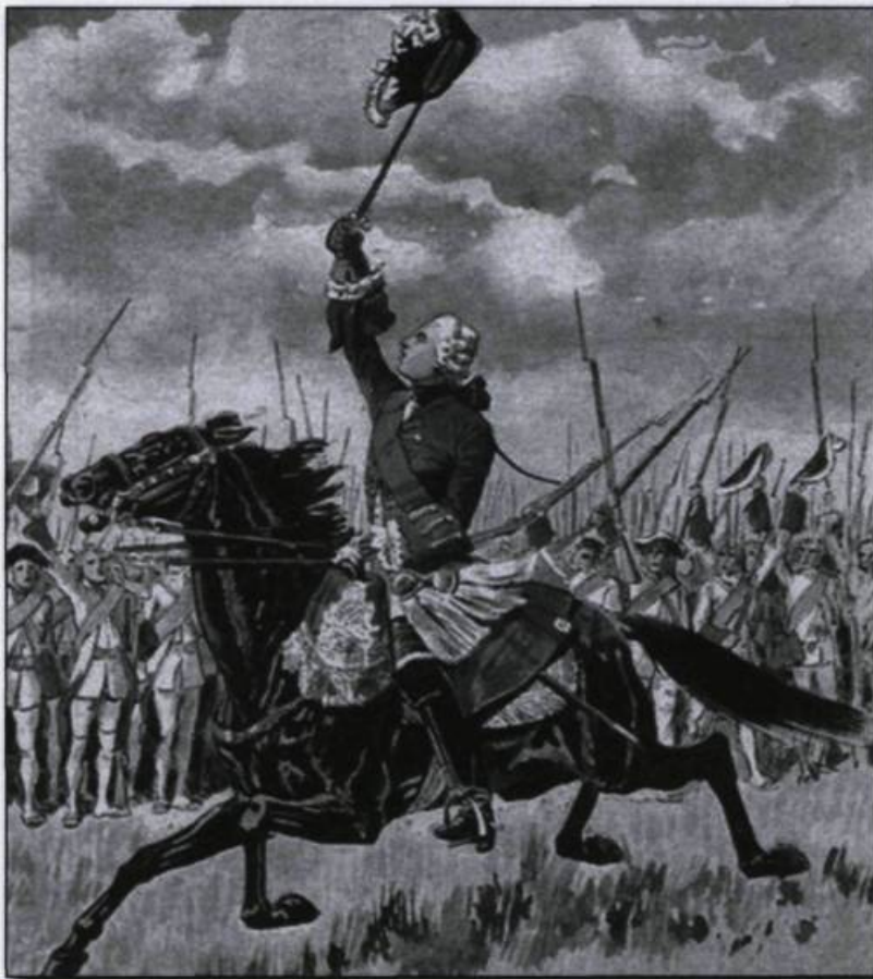
Louis-Charles Bombled. Le général Lévis à la bataille de Sainte-Foy, 1760, gravure, 1904.

Hélène Quimper est historienne à la Commission des champs de bataille nationaux.