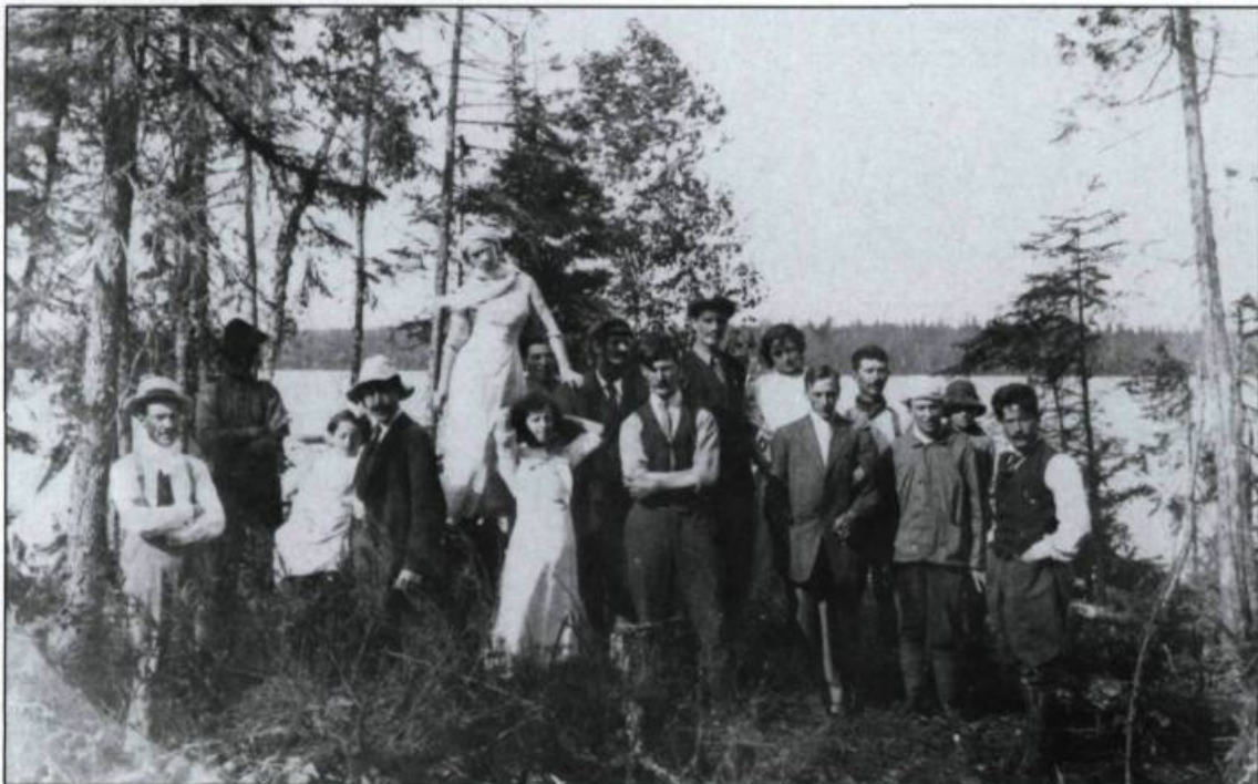
Groupe de colons au lac Okikiska, en Abitibi (6 juillet 1912).

culture devaient entraîner dès 1840 un mouvement migratoire vers les États-Unis. Ce mouvement prend une ampleur plus considérable au fur et à mesure qu'avance le XIX ème siècle. En effet, selon le géographe Raoul Blanchard, plus de 1 000 personnes quittent à chaque année la région pour les États-Unis ou pour les territoires de colonisation du Québec. Ce phénomène a même incité un généalogiste de Bellechasse à dénombrer les mariages de Franco-Américains de son comté. Au début du XX ème siècle, Kamouraska est le territoire le plus affecté. En 1909, 298 personnes quittent le comté; les deux tiers se dirigent vers les États-Unis. L'émigration touchera à peu près toutes les paroisses de la région.