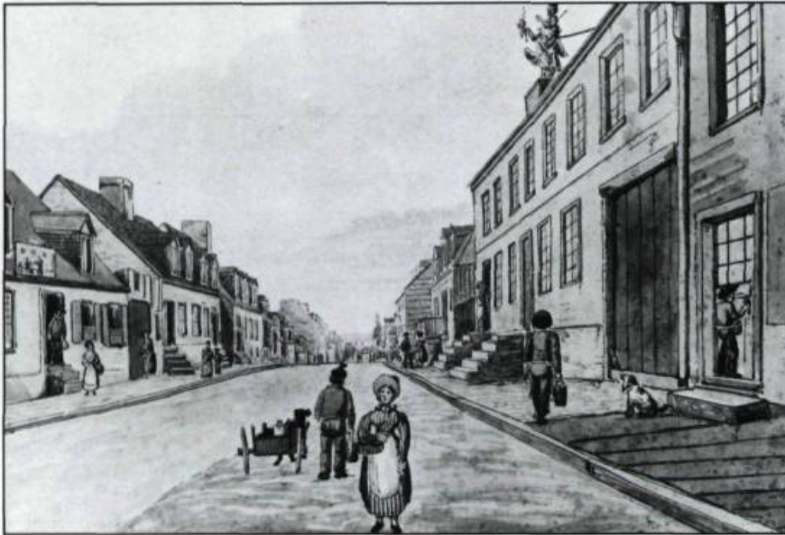
La rue Saint-Jean, vue vers l'est en 1830. Les maisons à l'avant-plan à gauche sont situées sur l'emplacement où se construira l'église après le feu de 1845. (Aquarelle de James Pattison Cockburn, Royal Ontario Museum).