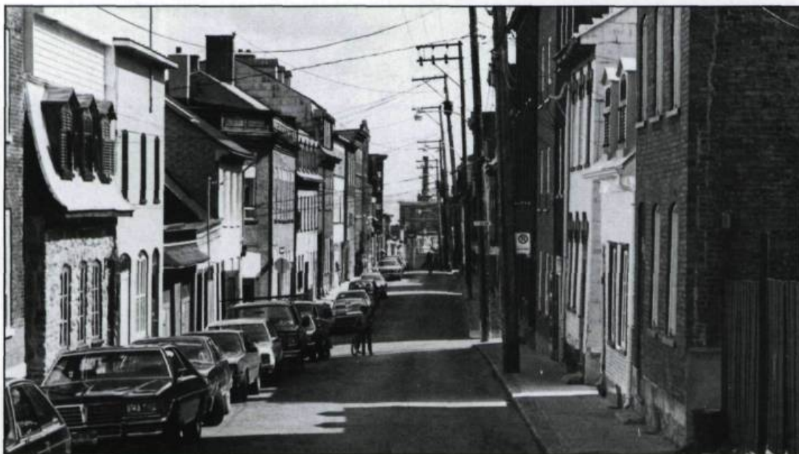
Un paysage typique du faubourg, la rue Latourrelle vue vers l'est.