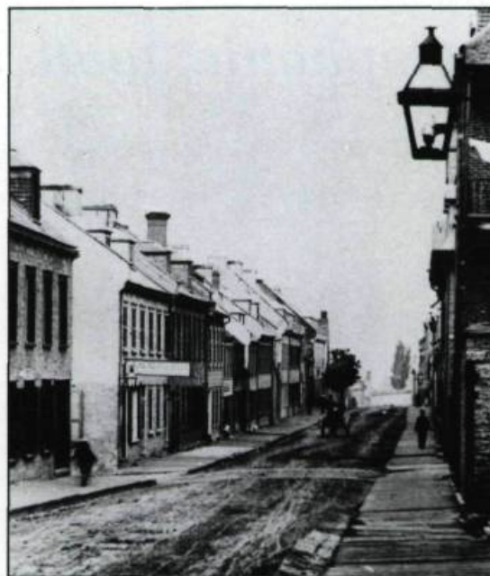
Ces maisons de la rue d'Aiguillon, vers 1900, illustrent un type architectural développé après l'incendie de 1845 par Frédéric Hacker et Thomas Baillairgé. (Inventaire des Biens culturels).

déré comme en attente de développement. S'il y a bien eu depuis quelques années un effort pour reconstruire des sites vacants à la suite d'incendies et l'installation de quelques équipements, rien n'est encore définitivement gagné pour l'avenir. Jusqu'à quel point la transformation de la côte d'Abraham affectera-t-elle l'habitat dans le faubourg? Les projets de Place Québec vont-ils se réaliser? A quand les ressources pour favoriser une politique de restauration domiciliaire un peu plus vigoureuse? Il y a aussi dans le faubourg la plus grande concentration per capita de poteaux, fils, transformations, panneaux de circulation et feux clignotants. A quoi il faut ajouter fenêtres d'aluminium et constructions ad hoc. A l'inverse il y manque le mobilier urbain le plus élémentaire qui contribuerait à marquer une volonté de revitaliser ce quartier. ♦