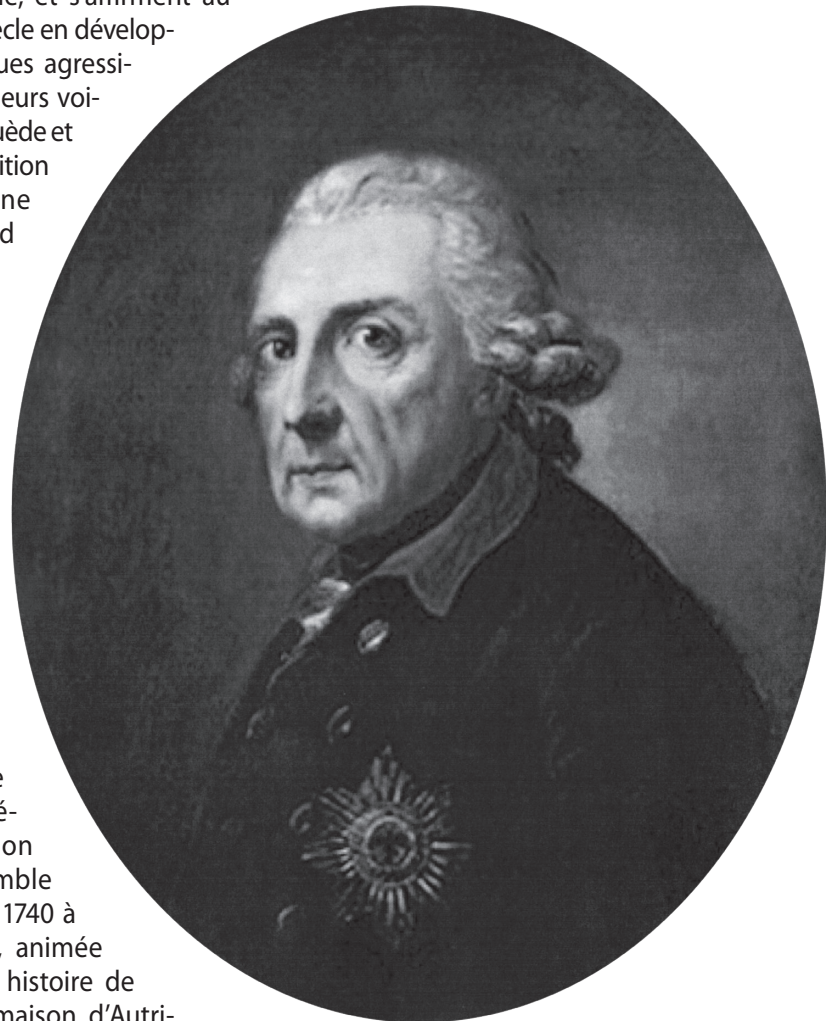
Frédéric II, roi de Prusse (1712-1786); huile sur toile d'Anton Raff, 1781. (Palais de Charlottenburg).