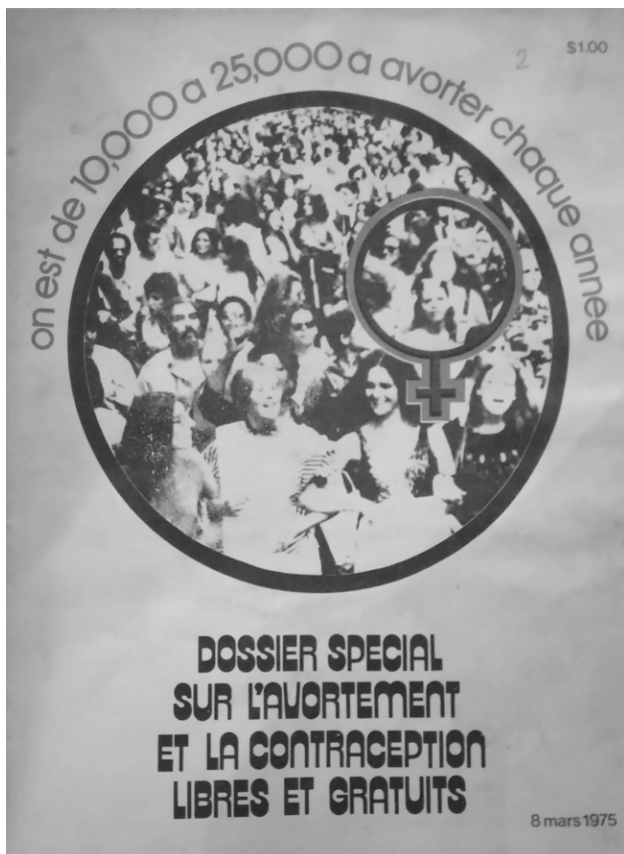
8 mars 1975.

Cet appel au respect du choix des femmes n'est pas resté un simple discours. Devant le manque d'accès à l'avortement en centres hospitaliers au Québec, les féministes du FLFQ, puis du Centre des femmes et du Comité de lutte, ont mis sur pied des réseaux illégaux d'avortement afin de répondre aux nombreuses demandes des Québécoises. J'aborderai principalement les actions du Centre des femmes de Montréal dans la première moitié des années 1970. Ce groupe est l'organisme héritier du FLFQ et s'inscrit dans la mouvance naissante du féminisme radical québécois. Le groupe reprend notamment la publication du journal Québécoises deboutte! lancé par le Front de libération des femmes. Cet article s'appuie sur les documents du fonds du Comité de lutte pour l'avortement libre et gratuit (CLALG), disponible au centre du Vieux-Montréal de Bibliothèque et Archives nationales du Québec (BAnQ-VM).