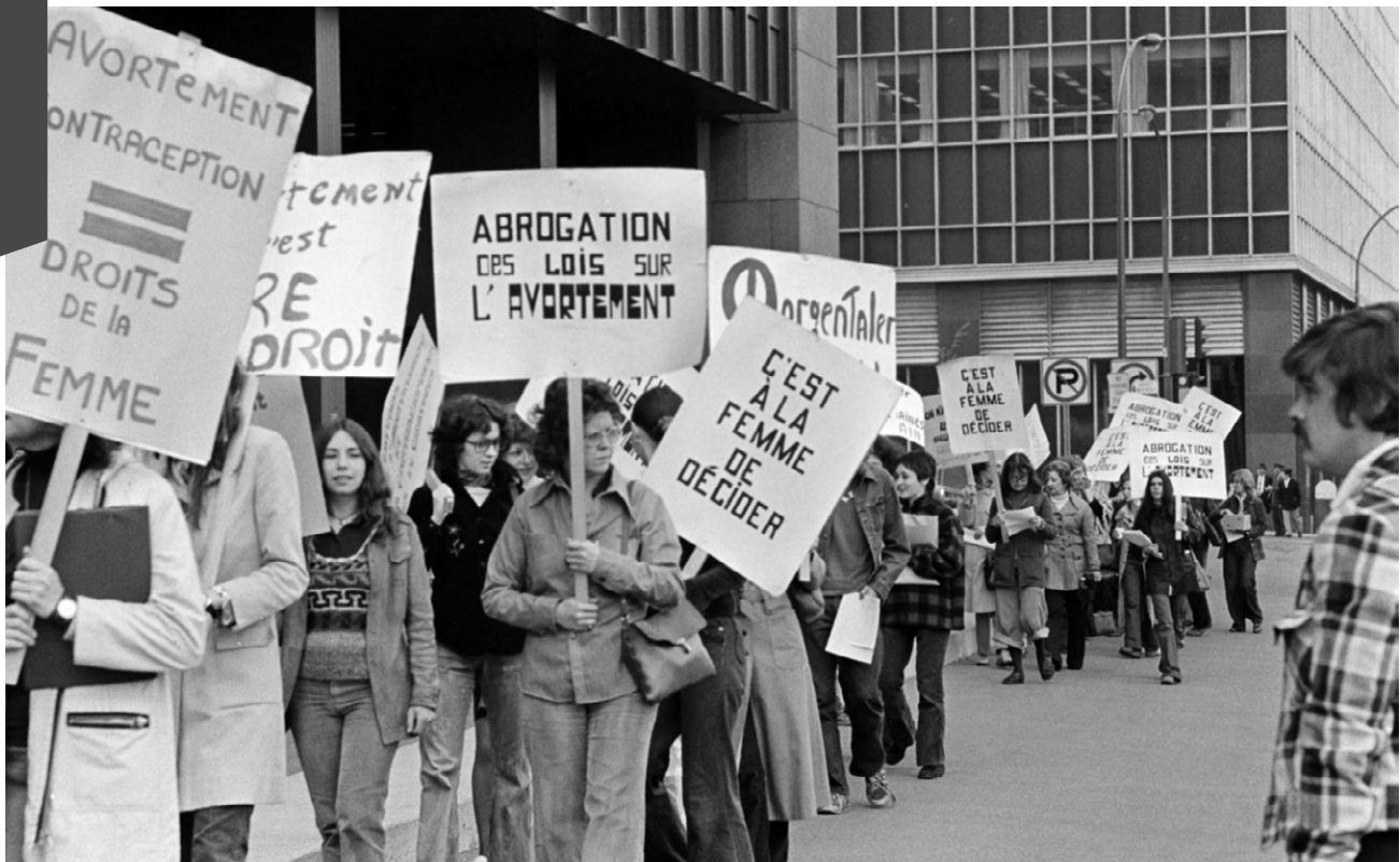
1969-1970. (Série Morgentaler manifestations;).