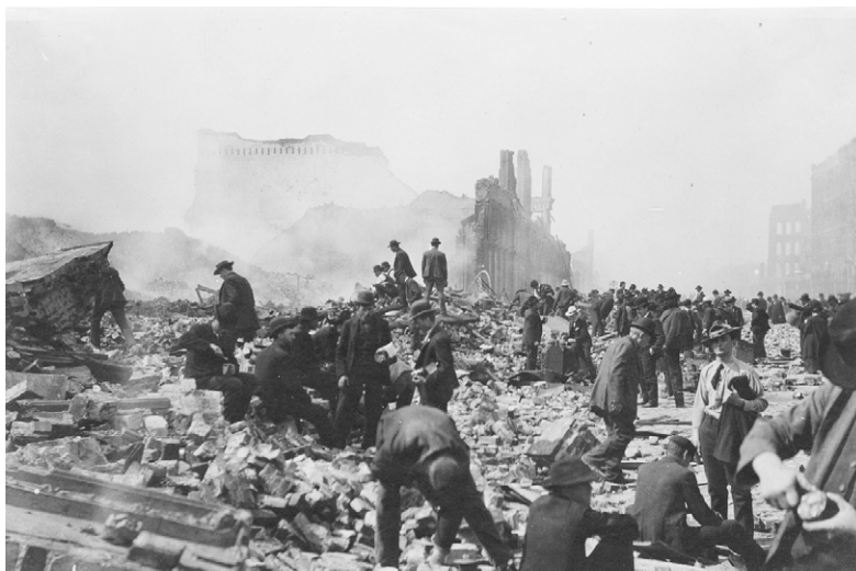
Citoyens de San Francisco à la recherche de souvenirs ou d'objets de valeur dans les débris à la suite du tremblement de terre. (U.S. National Archives, RG-46, Records of the U.S. Senate).

Klondike la même année pour faire de la prospection minière et la coupe de bois. Il y meurt, noyé, en 1904.