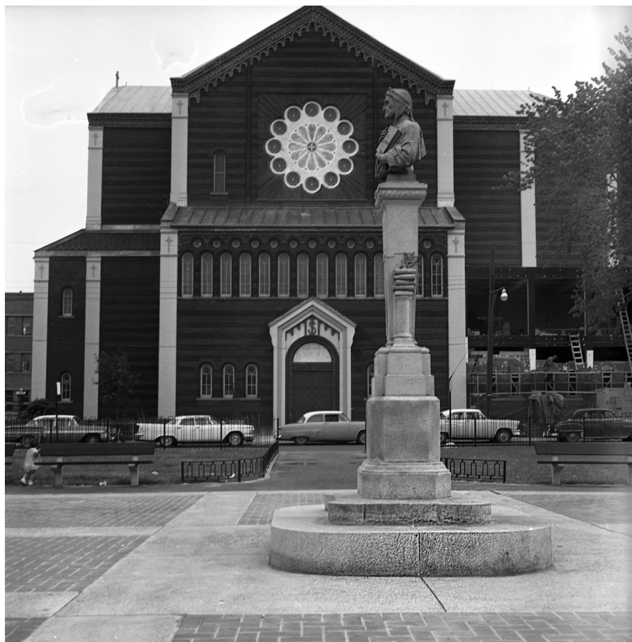
Église Notre-Dame-de-la-Défense (Madonna della Difesa), inaugurée en 1919. À l'avant-plan, le monument à Dante, œuvre de Carlo Balboni, offert à la Ville de Montréal par la « colonie » italienne en 1922. Il est déplacé à cet endroit, dans le parc Dante, en 1963. Photo de Louis-Philippe Meunier, 8 août 1963. (Archives de la Ville de Montréal, VM94-A0102-001.)

L'immigration italienne vers le Québec reprend avec force dans les années 1950 et se dirige essentiellement vers Montréal. Entre 1946 et 1961, elle amène plus de 77 000 personnes, près du cinquième de l'immigration totale. Les Italiens viennent alors au premier rang, devant les Britanniques. Ils restent en tête entre 1962 et 1970, mais avec environ 41 000 personnes, le mouvement ralentit. Il s'effondre dans la décennie suivante, avec à peine 10 000 nouveaux venus. La grande migration italienne vers le Québec, qui aura marqué le XX e siècle, est désormais terminée. Elle a tout de même donné naissance à une communauté forte, qui se perpétue. À partir de 1961, la population d'origine italienne dépasse celle d'origine juive et forme la plus nombreuse minorité ethnique du Québec