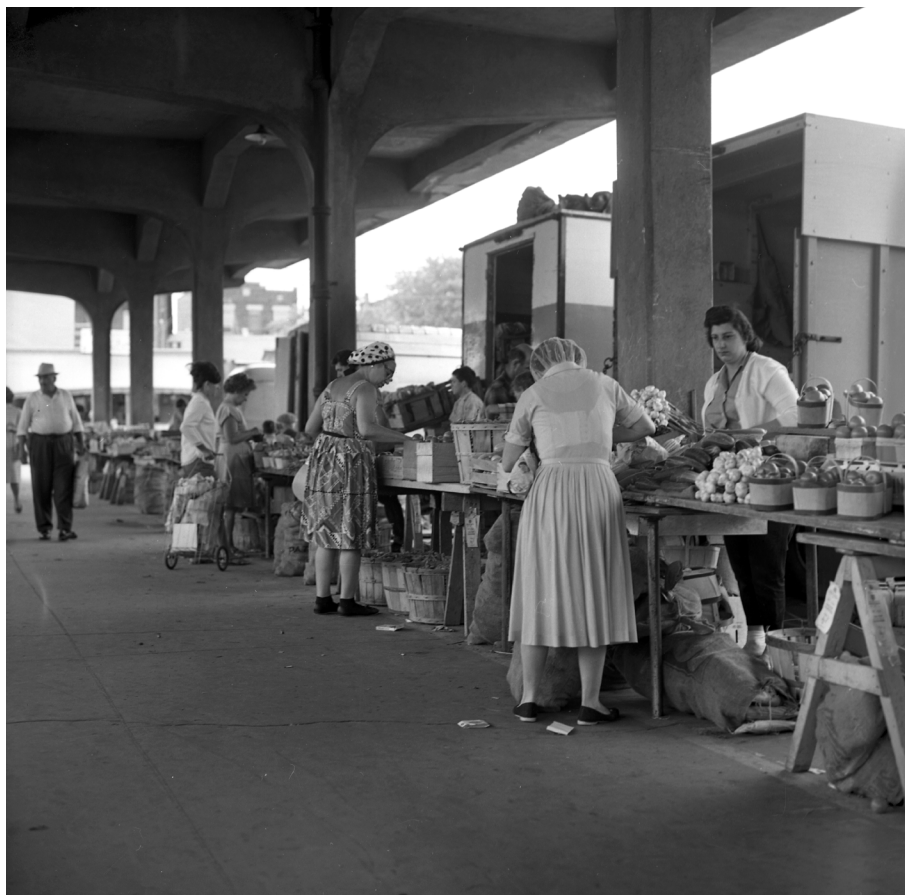
Situé au cœur de la Petite-Italie, le marché Jean-Talon est, depuis les années 1930, un lieu important de sociabilité, non seulement pour les habitants du quartier, mais aussi pour beaucoup d'autres Montréalais. Photo de Louis-Philippe Meunier, 8 août 1963. (Archives de la Ville de Montréal, VM94-A0102-006.)

de celui de la population de souche britannique. Finalement, la loi 101 n'a qu'un impact limité sur les italophones parce que les enfants déjà scolarisés en anglais obtiennent des droits acquis et