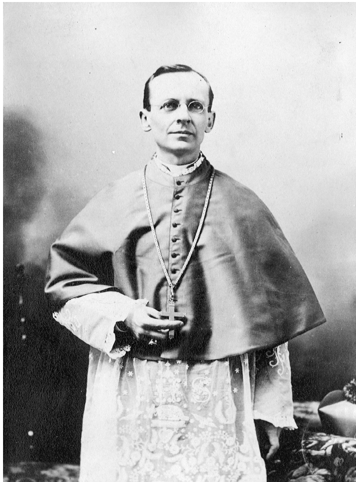
Descendant d'un immigrant italien, Paul Bruchési est archevêque de Montréal de 1897 à 1939. Photo du début du XX e siècle.

À partir du milieu de XIX e siècle, de nouveaux immigrants italiens, dont plusieurs artisans et des hommes d'affaires, s'installent au Québec. Parmi