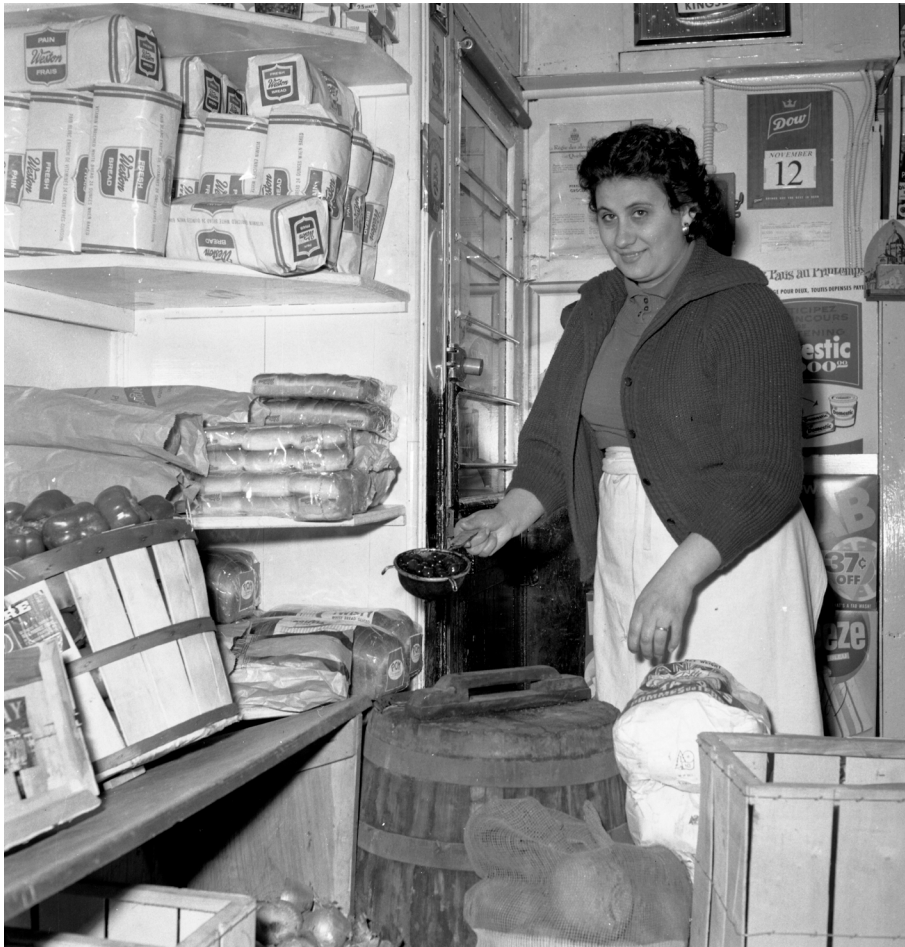
Cette marchande montre fièrement ses olives, conservées en barrique, dans une petite épicerie italienne du Village-aux-Oies (aussi connu comme Goose Village ou Victoriatown), dans le sud-ouest de Montréal. De nombreux immigrants Italiens y habitent dans l'après-guerre, mais le secteur est rasé par la Ville en 1964, au nom de la rénovation urbaine. Photo, 13 novembre 1962.