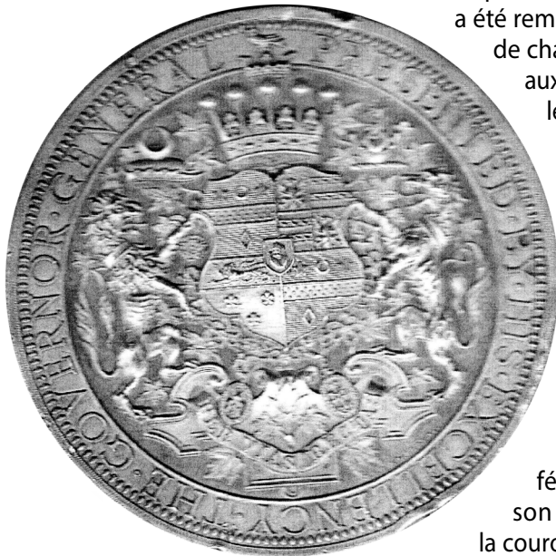
Avers et revers de la médaille du Gouverneur général Dufferin.

E n 1873, le gouverneur général du Canada, Frederick Temple Blackwood, lord Dufferin, bien connu pour ses interventions pour la protection des fortifications et des anciennes portes de Québec, a fait émettre une médaille à son effigie et à celle de son épouse, Harriot Georgina Rowan Hamilton par la maison Wyon, de Londres. Cette médaille est frappée en or, en argent ou en bronze. Tous les gouverneurs qui se sont succédé depuis ont poursuivi l'initiative. La médaille a été remise d'abord aux gagnants de championnats sportifs, puis aux étudiants méritants dans les institutions d'enseignement canadiennes.