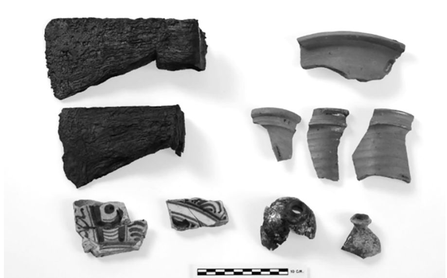
Hache espagnole, fragment d'un plat en terre cuite normande, coin à fendre, fragments de trois pots en grès normands, fragments d'un plat de service en majolique des Pays-Bas, fragments de deux bouteilles en verre (1626-1629).

Le bâtiment est conservé jusqu'en 1647 alors que le gouverneur Montmagny le fait raser pour construire le premier château Saint-Louis. Marie de l'Incarnation, en 1644, précise que ce logis est en pierre. Les niveaux archéologiques associés aux deux premiers forts ont livré d'autres indices reliés à ce bâtiment : présence de tuiles à toiture, de carreaux à plancher, de verre à vitre et de clous