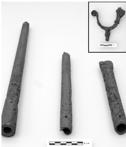
Deux canons d'arquebuse côtoient un canon de mousquet dont l'extrémité a été délibérément écrasée. En mortaise, la partie supérieure d'une fourquine qui servait à supporter le canon du mousquet, aidant à ajuster son tir.