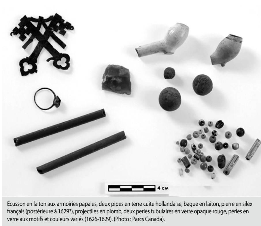
Écusson en laiton aux armoiries papales, deux pipes en terre cuite hollandaise, bague en laiton, pierre en silex français (postérieure à 1629?), projectiles en plomb, deux perles tubulaires en verre opaque rouge, perles en verre aux motifs et couleurs variés (1626-1629).

Plusieurs pipes en terre cuite et deux autres en pierre de facture amérindienne, des perles tombées de vêtements et de parures, ainsi que quelques pierres (chert) taillées selon les techniques utilisées par les Amérindiens, indiquent la présence de ces derniers dans le fort Saint-Louis. Ils sont probablement venus rencontrer le chef de la colonie française pour entretenir les