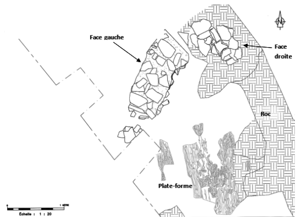
Plan présentant les vestiges de la plate-forme à canon de l'extrémité nord du premier fort et de son parapet en forme d'éperon. Cette plate-forme pourrait avoir été construite pour couvrir la côte de la Montagne tracée en 1623. (Plan : Parcs Canada).

Chacune des enceintes présente une défense qui permet le flanquement de l'ensemble de ses parties, commande avantageusement le terrain environnant et assure donc une protection efficace. Les remparts faits de terre, fascines, gazon et bois, sont revêtus de pieux du côté extérieur, alors qu'un parapet de bois complète le sommet des enceintes. Des plates-formes supportent, dans l'enceinte extérieure, des canons pointés vers la rade, l'habitation, la côte de la Montagne et la campagne voisine du fort. Les portes en chicane des deux remparts ne sont pas en vis-à-vis et des