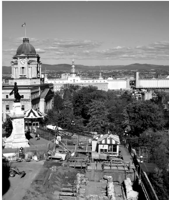
La partie nord de la terrasse Dufferin vers la fin de la première campagne de fouille en 2005, vue vers le nord; l'est est à droite. Le monument à Champlain domine le secteur de fouille dans lequel on aperçoit une partie des caves du château Saint-Louis, qu'utilise également le bâtiment d'accès au funiculaire qu'on voit au centre. La construction du château Saint-Louis est postérieure à l'occupation du fort Saint-Louis par le fondateur de Québec.

L'organisation du chantier archéologique s'articule autour des vestiges de l'ancien château Saint-Louis (1647-1834). Dans le périmètre intérieur du château, la décision de conserver en place les dalles du plancher du bâtiment limite à une toute petite surface la fouille des niveaux de sol de l'époque de Champlain. C'est devant et derrière le château que sont trouvés les éléments les plus éloquentes de l'époque du fondateur de Québec. Les segments du fort