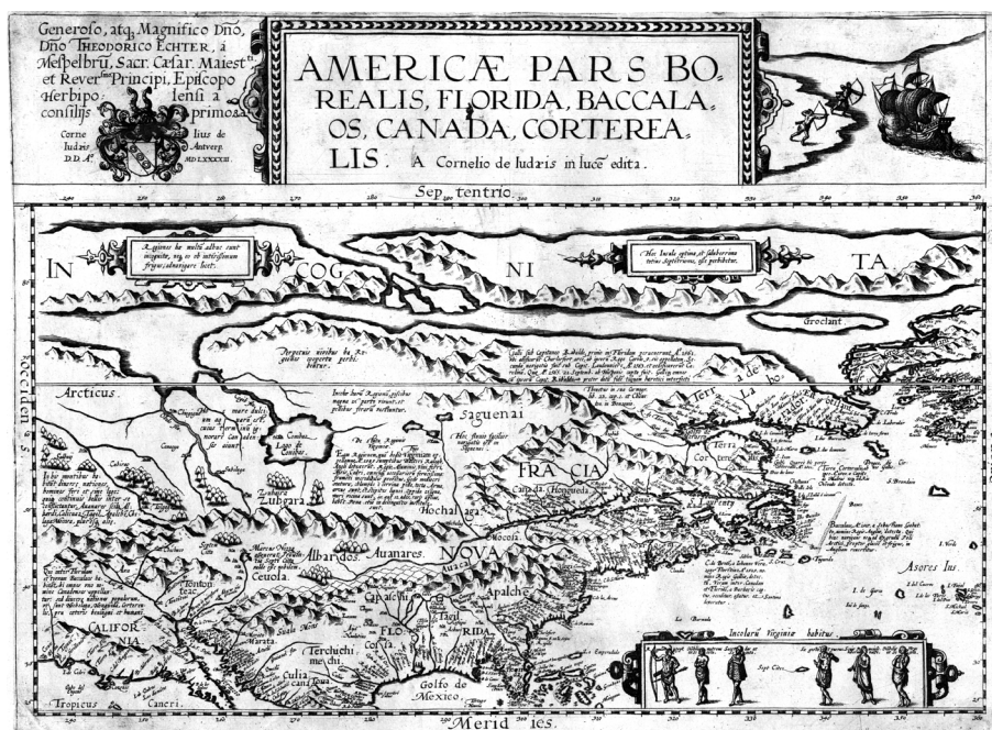
Americae Pars Borealis de Cornelis de Jode, 1593. Le passage du Nord-Ouest est très nettement représenté. Cette carte est chargée d'informations. En haut à droite, le cartographe évoque l'attaque dont fut victime Frobisher. Sur la côte atlantique, il rappelle l'épisode de Laudonnière et Ribault. Ce dernier fut traîtreusement mis à mort par Pedro Menéndez, l'émisnaire de Philippe II. Jode multiplie les emprunts et prend plaisir à s'inspirer de John White et de Le Moyne de Morgues.