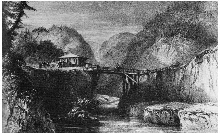
La maison du gardien du pont de péage Déry (Pont-Rouge, Québec). Gravure d'après une œuvre de R. J. Hamerton publiée en 1845. (Frederick Tolfrey, The Sportsman in Canada ).

Le site historique du pont Royal (renommé pont Déry) à Pont-Rouge, qui conserve sa maison du péager bâtie en 1804, est probablement le plus précieux vestige de cette époque. Il tire son nom de la famille qui a habité la maison de 1816 à 1939. Le premier pont de bois est construit au-dessus de la rivière Jacques-Cartier à une dizaine de kilomètres de son embouchure afin de profiter du rétrécissement de son cours entre des rochers escarpés. Ce pont à péage « curieusement construit », selon l'expression de l'officier britannique Frede-