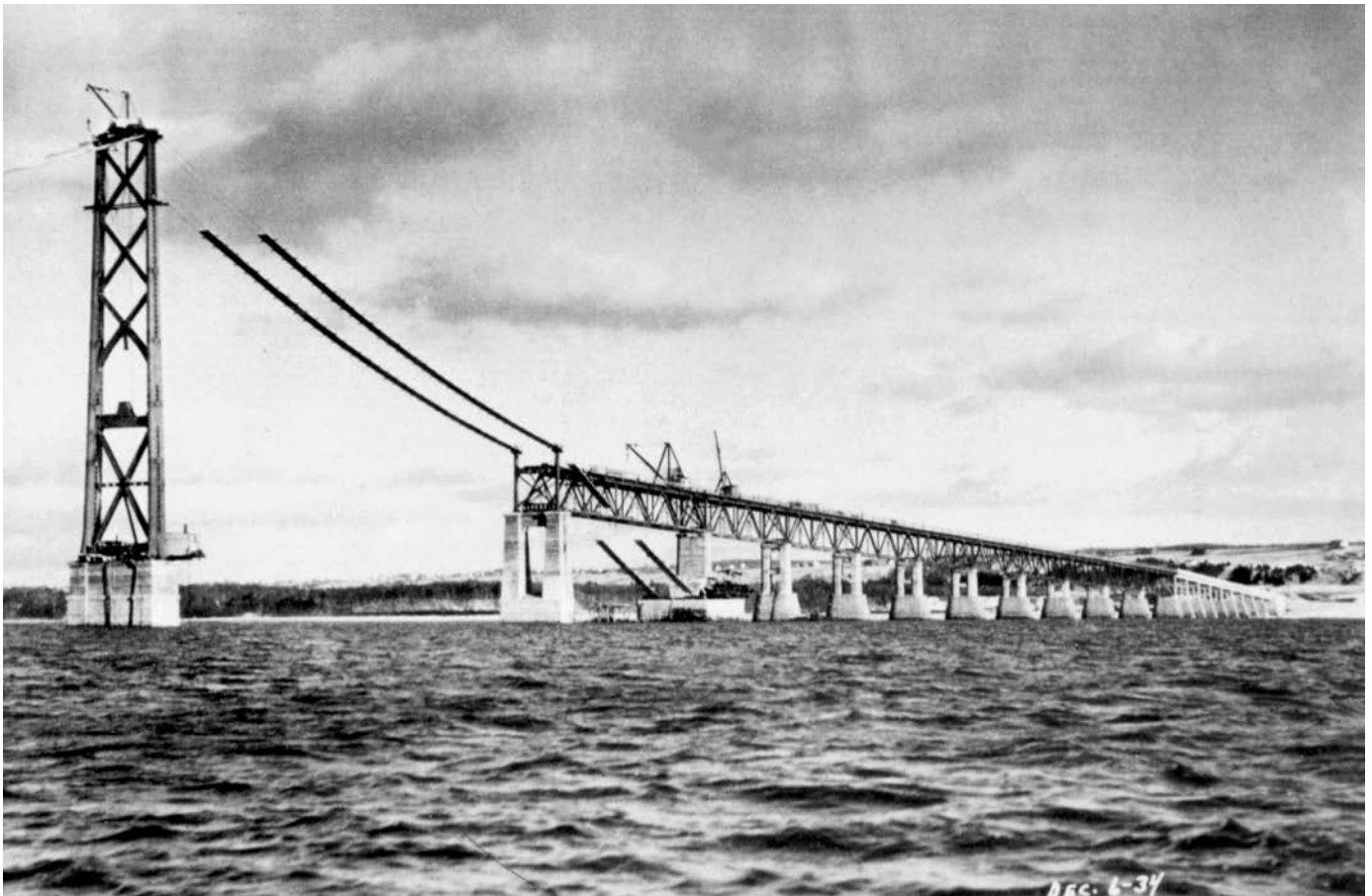
Construction du pont de l'île d'Orléans en 1933-1934.