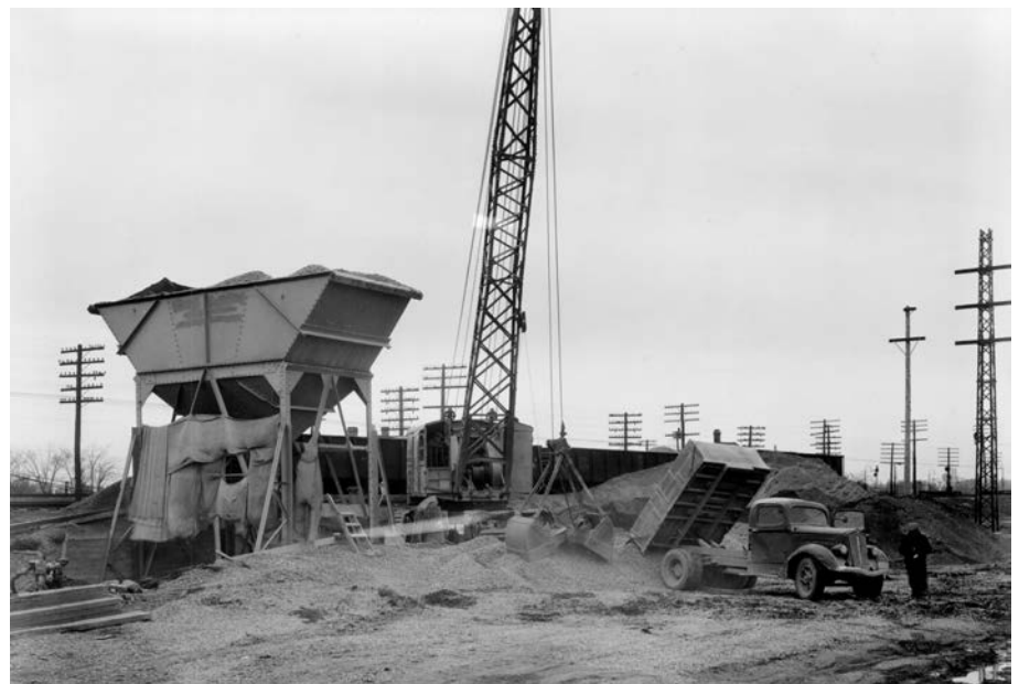
Construction du boulevard Lakeshore, Sainte-Anne-de-Bellevue, 1940.

De nos jours, le mot « communication » implique spontanément l'instantané et le virtuel, la transmission des messages et des données. Mais il y a un siècle, et