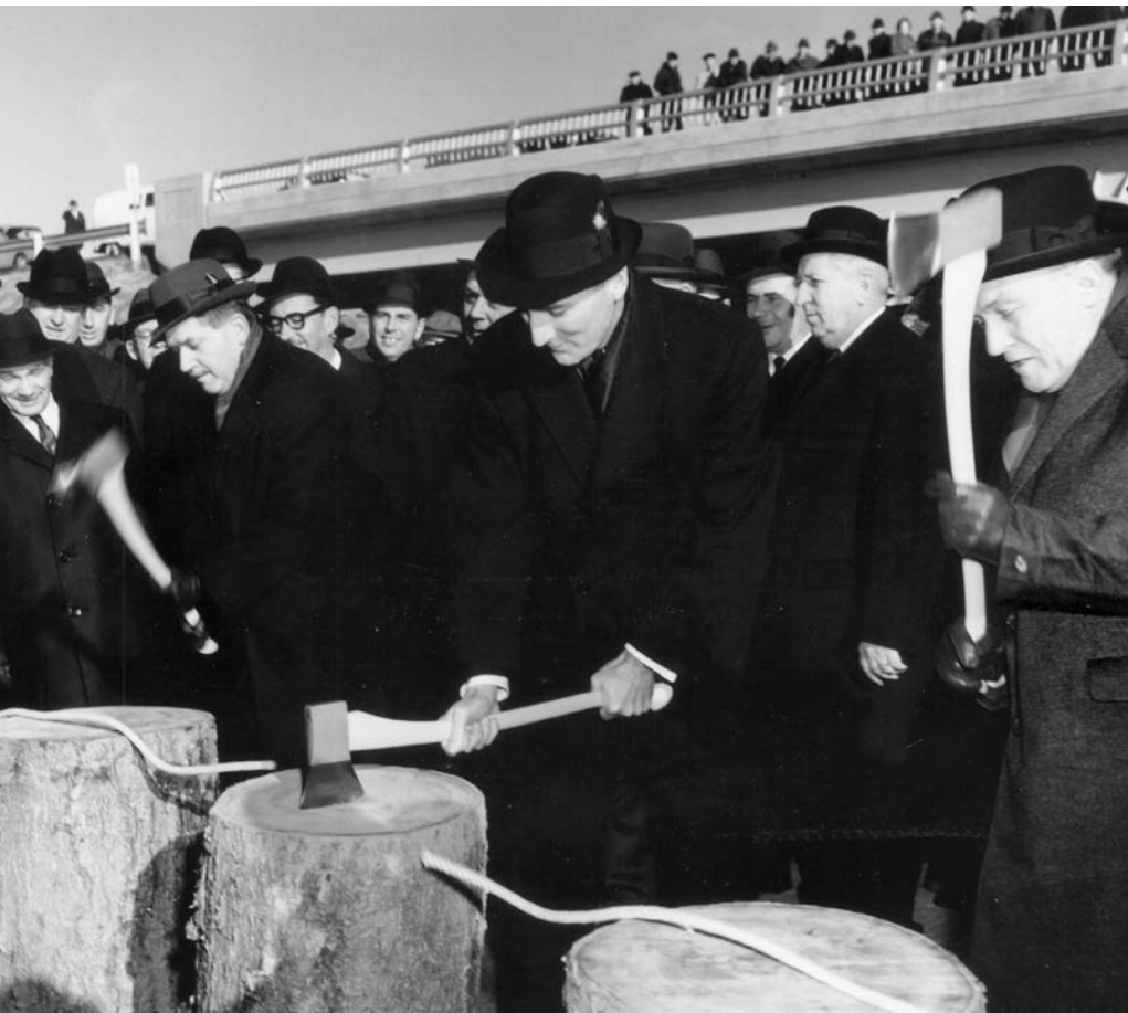
Inauguration du tronçon de 130 miles de Saint-Hilaire à Saint-Nicolas de la route Transcanadienne par le ministre de la Voirie, Bernard Pinard, en 1964. (Archives du ministère des Transports du Québec).

1977 et est supervisée par le ministre en 1980. Cette même année, le ministère des Transports intégrera le Bureau des véhicules automobiles.