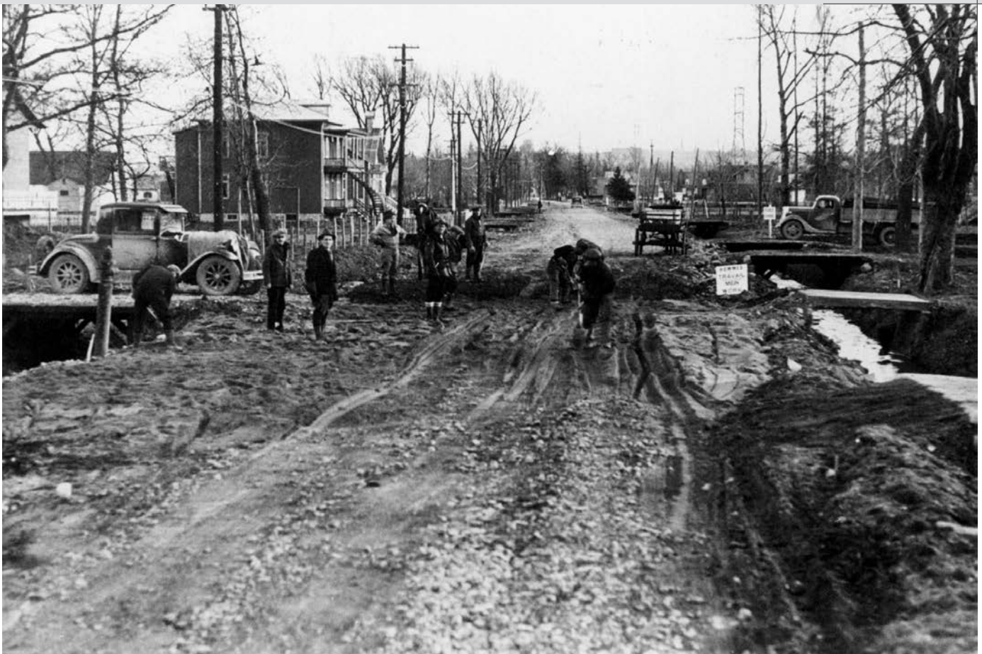
Route en construction, 1930-1939.

avec « modernisation ». Ainsi, du 20 au 25 juillet 1929, on inaugure officiellement la nouvelle « route du tour de la Gaspésie », allant de Sainte-Flavie à Sainte-Flavie : celle-ci fait 889 kilomètres.