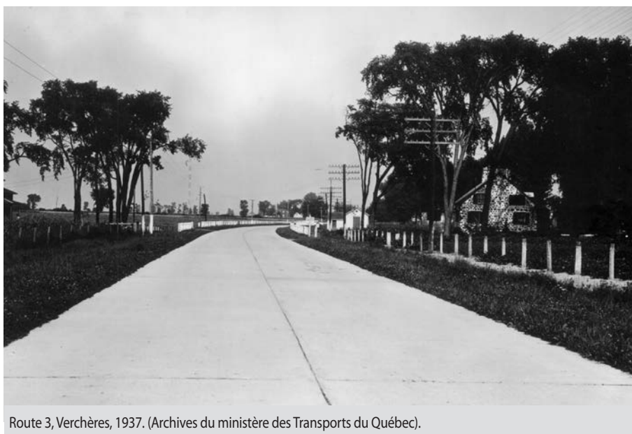
Route 3, Verchères, 1937.

Un nouveau changement administratif encore plus conséquent survient à peine quelques années plus tard. Le 14 mars 1972, le gouvernement québécois fusionne le ministère des Transports et le ministère de la Voirie, après l'adoption de la Loi organique du ministère des Transports du Québec. Cette opération, officialisée le 1 er avril 1973, mettait fin à la référence explicite à la voirie dans le nom d'un ministère québécois. D'ailleurs, le rapport annuel de 1973 émanant du ministère des Transports, intitulé Les transports en 1973 , parlait alors de « véritable bouleversement » comparativement à l'ancienne Régie des transports existant depuis 1949. Ce changement de nom n'était pas une simple mise à jour, mais représentait une réforme administrative profonde et une forme de démocratisation.