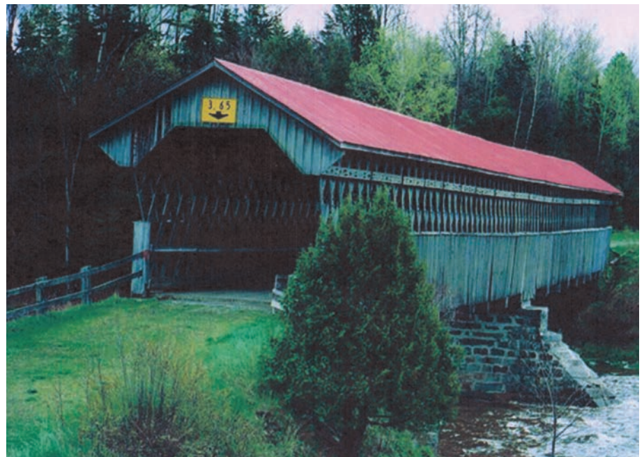
Les ponts couverts ont été la pierre angulaire de la colonisation de 1815 à 1955. Sur cette photographie, le pont McVetty-McKerry, à Lingwick, en Estrie, construit en 1893.

Au Québec, le réseau de chemins à améliorer après trois siècles d'occupation était très étendu. En 1921, le Québec et l'Ontario regroupaient 60 % de la population canadienne qui comptait seulement 8,8 millions d'habitants. C'est également au Québec que les grandes routes interprovinciales et internatio-