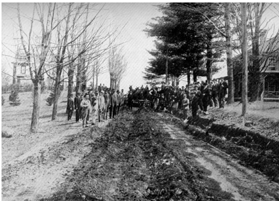
Cours de macadamisage à Knowlton, 1913. (Rapport du ministère de la Voirie de la province de Québec, 1913).

Le ministère de l'Agriculture devait orchestrer une campagne de « propagande », comme on disait à l'époque, en faveur des bonnes routes dans les journaux, dont le Journal d'agriculture , et par le biais de conférences aux quatre coins de la province. Cette stratégie de com-