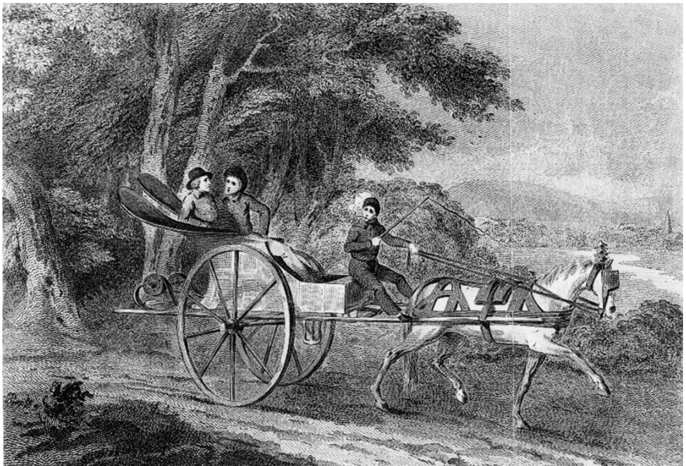
Canadian Calash or Marche-Donc. Gravure publiée en 1798. Isaac Weld, dessinateur; J.B. Drayton, graveur. (Collection Yves Beauregard).

À cette route de canotage s'en ajoutent d'autres, dont celle du Saguenay, qui mène au système hydrographique de la baie d'Hudson. De même, le Richelieu permet au bois (douves et madriers) du lac Champlain d'être acheminé par radeau vers Québec et aux pelleteries montréalaises d'être vendues sur le marché new-yorkais. Par ailleurs, en hiver, tant les Innus nord-côtiers que des habitants de la colonie naviguent en canot à travers les glaces.