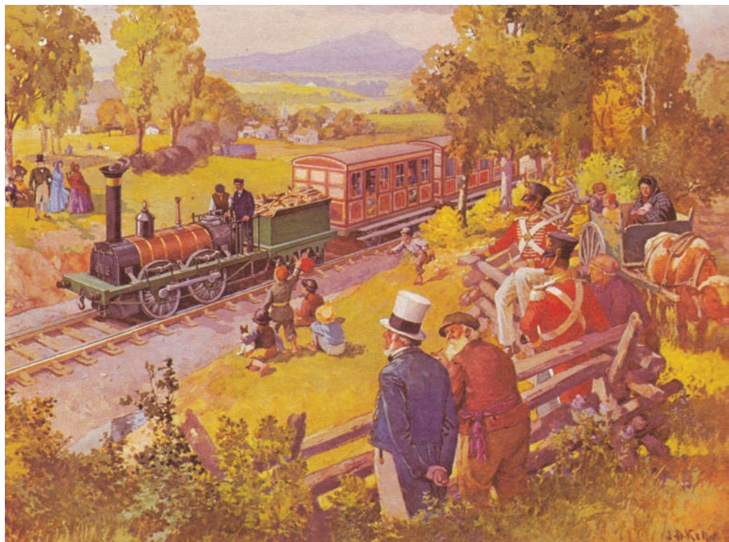
Le premier chemin de fer au Canada, entre Laprairie et Saint-Jean, Québec. Estampe, J.D. Kelly. (Collection Confederation Life).

Avec la Révolution américaine, l'administration coloniale entend remédier à l'état lamentable des routes sur son territoire. Territoire qui d'ailleurs s'agrandit