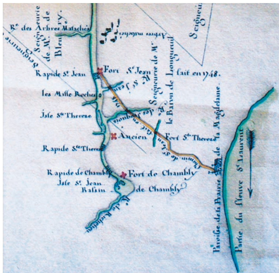
Extrait de la carte du lac Champlain, 1752. Louis Franquet. (Original conservé aux Archives du Séminaire de Québec, Musée de la civilisation, Québec).

Jusqu'à la Révolution américaine, le portrait du transport de la Province of Quebec n'évolue guère. Ainsi, les trois plus