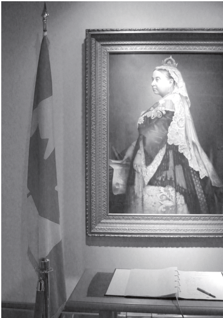
Photo de la reine Victoria dans l'hôtel de ville d'Ottawa.

Aujourd'hui, à l'intérieur de la fédération canadienne, les provinces jouissent, sur le plan juridique, d'une souveraineté véritable dans l'exercice de leurs compétences constitutionnelles. Elles disposent de pouvoirs législatifs qui leur sont propres et d'importantes sources de revenus. Toutefois, dans les faits, cette souveraineté doit être relativisée à la lumière d'un certain nombre de facteurs susceptibles de favoriser la centralisation du régime canadien, comme le pouvoir du Parlement de légiférer en matière d'urgence et d'intérêt national, le pouvoir de ce même parlement de soumettre à son autorité certains ouvrages ou entreprises de nature