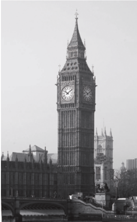
La tour de Big Ben, au palais de Westminster à Londres, vue depuis la Tamise.

locale, la prépondérance des lois fédérales sur les lois provinciales en cas de conflit entre celles-ci, le droit du gouvernement du Canada de dépenser dans les champs provinciaux, la compétence du Parlement à l'égard des matières résiduelles, la possibilité pour le Parlement d'empiéter sur les compétences provinciales, notamment par l'utilisation de ses pouvoirs accessoires, la prépondérance fiscale de l'ordre fédéral de gouvernement, le principe voulant que les lois fédérales puissent lier les provinces, mais pas l'inverse, etc.