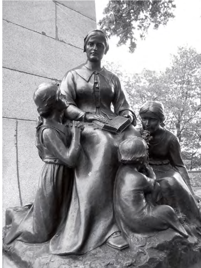
Marie Rollet et ses enfants, représentés par le sculpteur Alfred Laliberté pour le monument de Louis Hébert, à Québec, en 1918.