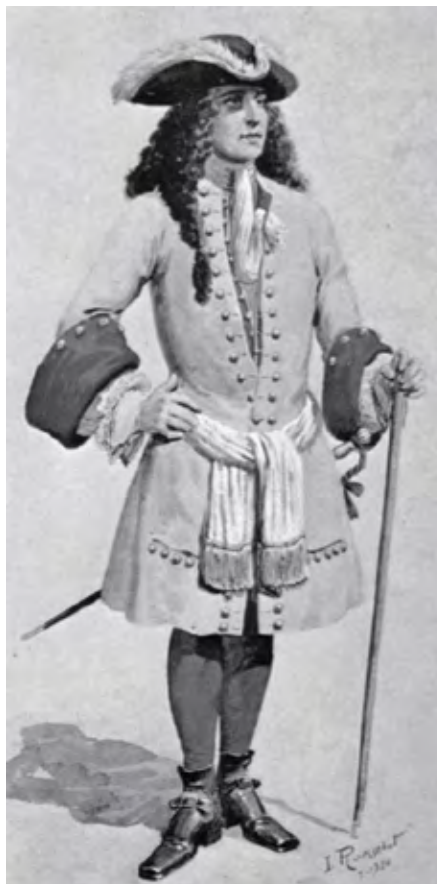
Officier des compagnies franches de la Marine, 1697-1703.

tages à occuper un poste d'officier de milice comme du prestige et de la reconnaissance sociale. De plus, la milice s'avère un lieu favorisant le tissage de liens privilégiés avec le pouvoir colonial, ce qui permet à certains nobles, par exemple, de se faire élire