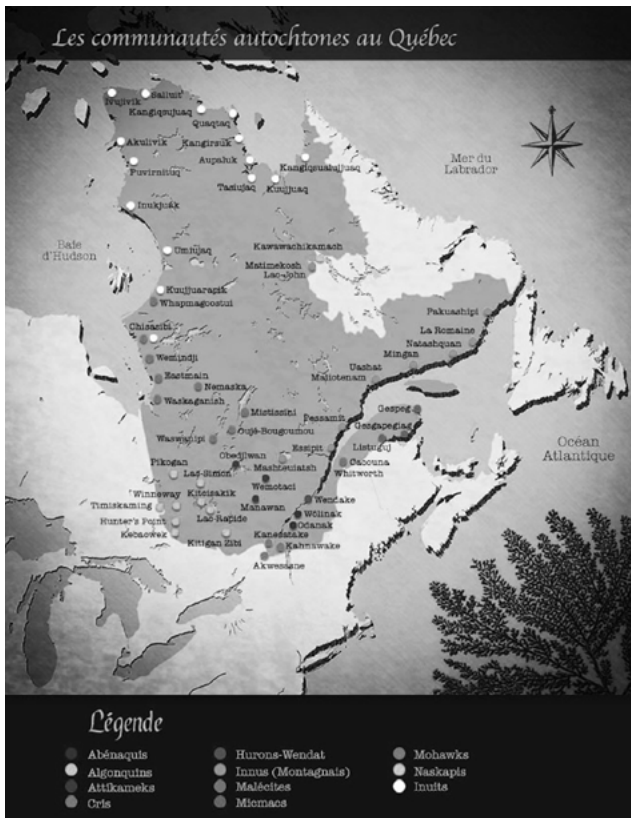
Les communautés autochtones au Québec. Secrétariat aux affaires autochtones du Québec. ( http://www.paricilademocratie.com/approfondir/pouvoirs-et-democratie/1530-pouvoir-et-democratie-depuis-1867 ).

nement québécois comme le démontre l'historienne Émilie Ducharme dans son mémoire de maîtrise. Deux forces parallèles influencent cette évolution : une provenant du haut, du gouvernement, et l'autre provenant du bas, des Autochtones eux-mêmes qui, loin d'être passifs, défendent avec plus de vigueur leurs intérêts dans la deuxième moitié des années 1960.