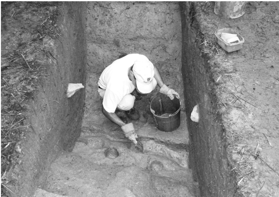
Dégagement des pieux en quinconce de la palissade double du fort Sainte-Thérèse lors des fouilles archéologiques de 2009. (Parcs Canada).

documenter les modes de construction des forts de Sorel et Sainte-Anne, des tranchées creusées dans le sol naturel pour installer les palissades ont été mises au jour dans les trois autres forts. À Chambly, une tranchée d'une largeur d'un pied sur une profondeur d'au moins trois pieds a été découverte sur des segments de courtines et de redans. À Saint-Jean, une étroite tranchée évasée, d'une largeur d'un pied au fond sur une profondeur de deux pieds et demi, traçait le flanc gauche du bastion sud-ouest du fort. Au fort Sainte-Thérèse, les vestiges découverts sur plusieurs segments de l'ouvrage se démarquent. La tranchée d'installation des palissades est plus large (un pied et demi au fond) et plus profonde (quatre pieds) que celles de Chambly et Saint-Jean. De plus, des empreintes de deux rangs de pieux ont été mises au jour. Le fort Sainte-Thérèse, le plus au sud, donc le plus exposé des forts construits en 1665, possédait une palissade de pieux doubles jointifs et disposés en quinconce, appelée palanque. Pendant l'action guerrière, les hommes mobilisés logeaient sans doute sous la