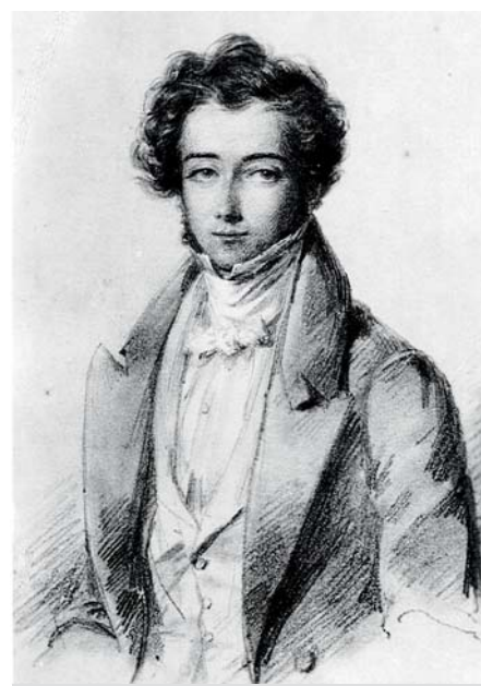
Alexis-Henri-Charles Clérel, vicomte de Tocqueville (1805-1859).