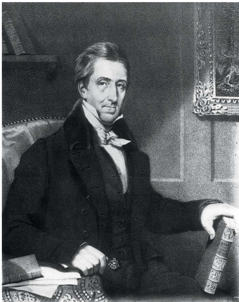
L'honorable Denis-Benjamin Viger (1774-1861).

Le problème des rapports entre Canadiens français et « Britanniques » (ou