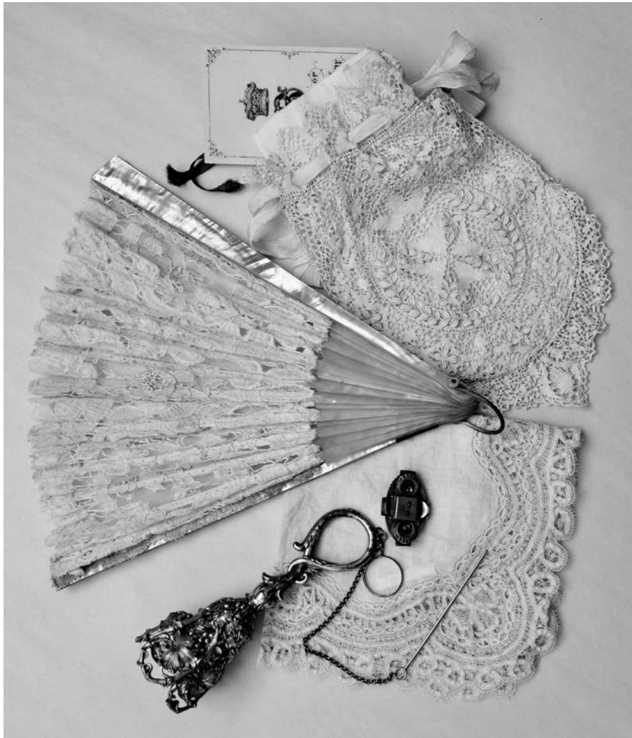
Accessoires de soirée : mouchoir, porte-bouquet, broche, éventail, réticule et carnet de bal. (Coll. Parcs Canada, Lieu historique national de Sir-George-Étienne-Cartier, photo : David Ledoyen).

blanc garni de mauve ou de violet est permis. De leur côté, les hommes portent l'habit noir avec la veste intérieure blanche et la cravate blanche ou noire, des bottes en cuir fin, des gants et un mouchoir de poche blancs.