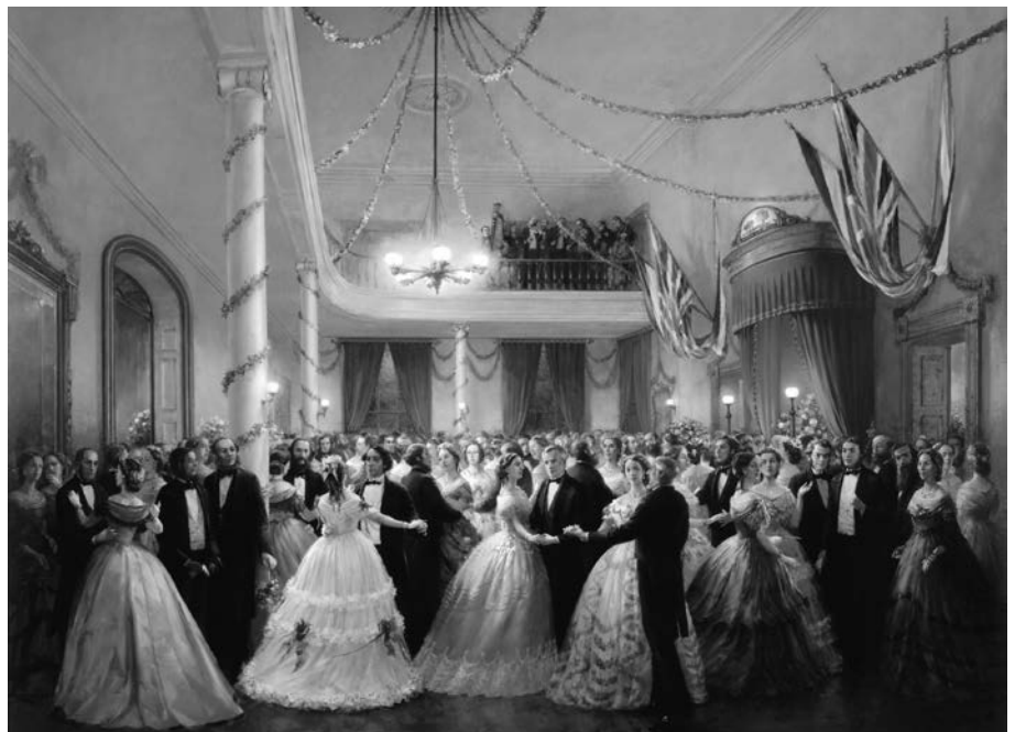
Bal public et banquet à Province House, Charlottetown, septembre 1864, par Dusan Kadlec. Cette représentation fidèle de la mode vestimentaire et des bals de l'époque évoque deux des trois grandes activités mondaines qui se sont déroulées dans l'édifice du parlement du Canada-Uni, en octobre 1864. (Photographie courtoisie de Dusan Kadlec et de l'Agence Parcs Canada).

Finalement, s'ajoutent les repas que le gouverneur général réserve à de petits groupes d'invités à son domicile de Spencer Wood ainsi qu'au parlement. Finalement, ces activités à caractère privé et convivial, dont il n'existe qu'un inventaire partiel et des descriptions sommaires, laissent entrevoir des jeux de coulisses inhérents à tout rassemblement de nature politique. Les sources ne permettent pas toutefois d'en mesurer l'effet sur les rapports qui se tissent entre les convives (délégués, représentants de la couronne, représen-