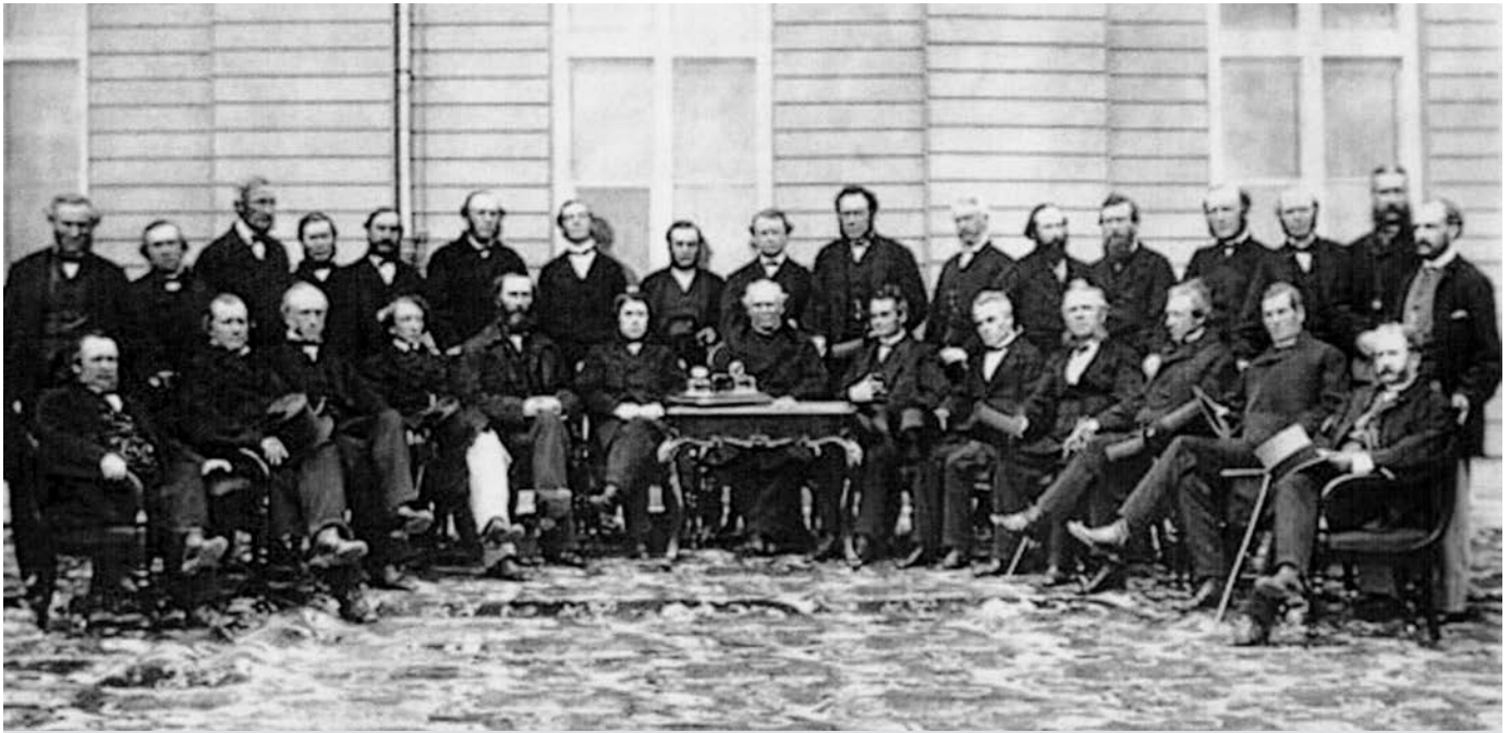
Les délégués à la Conférence de Québec de 1864.