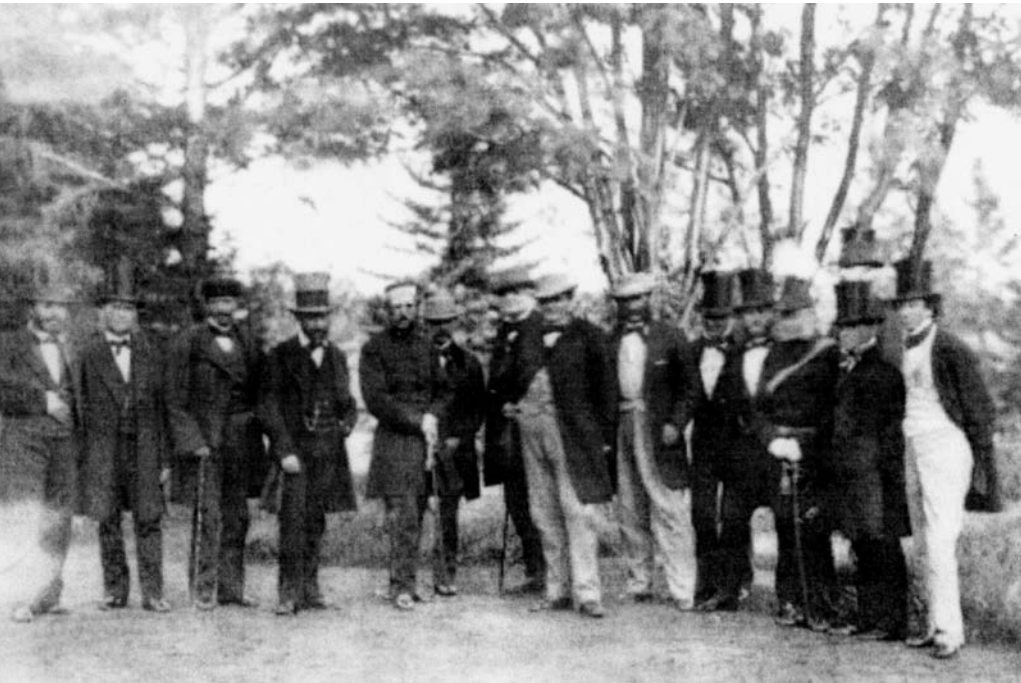
Groupe de délégués photographiés dans un jardin (Spencer Wood ?).

des bals en tire un grand prestige; elle et sa mère en reçoivent tout le crédit. À l'opposé, on considère que celle qui n'a pas trouvé un parti après ses deuxième et troisième participations a échoué et se voit « condamnée » au célibat, un statut peu envié au regard de ses contemporains et de l'idéal féminin prescrit. La saison des activités mondaines et du marché du mariage constituent donc des rites de passage, voire des phénomènes incontournables dans la Grande-Bretagne victorienne dont l'influence culturelle résonne à divers degrés dans les couches sociales aisées des colonies d'Amérique du Nord.