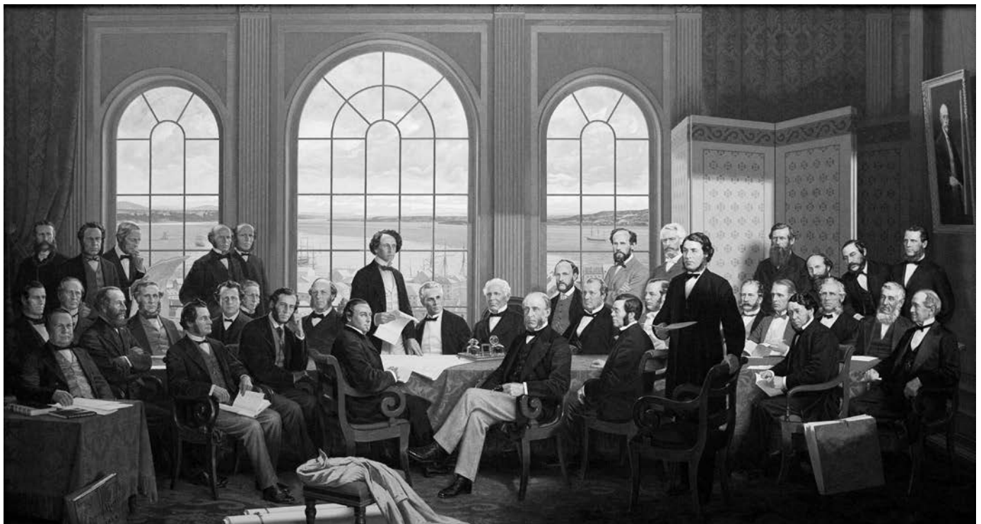
« Les Pères de la Confédération ». Peinture par Rex Woods, 1968; huile sur toile 213,36 x 365,72 cm. (Collection de la Chambre des communes, Ottawa).

Néanmoins, les deux salles se remplissent rapidement d'hommes en uniforme militaire ou en habit de gala et de femmes toutes plus élégantes les unes que les autres. Le choix de l'habillement répond à des critères spécifiques. Le style et la couleur des robes varient selon l'âge et le statut des dames : les robes des jeunes célibataires sont fabriquées de tissus légers comme la mousseline, le tulle, la soie, de couleurs s'agaçant à leur carnation; les femmes plus âgées, choisissent la moire antique. Des parures de fleurs fraîches, des rubans ornent les têtes et les robes. « [...] le bal [...] a fait écouler sur le marché plus de gants, de fleurs, de rubans et de dentelles que n'en vendront nos marchands le reste de l'année [...] » rapporte La Minerve . Les gants blancs sont d'usage pour la danse ainsi que les souliers en satin blanc ou noir selon les couleurs des robes. Les veuves qui ne sont pas encore autorisées à danser optent pour le noir et le violet. Si elles peuvent danser, le