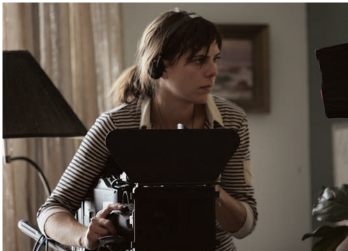
Sophie Deraspe à la caméra pour son film Les Signes vitaux