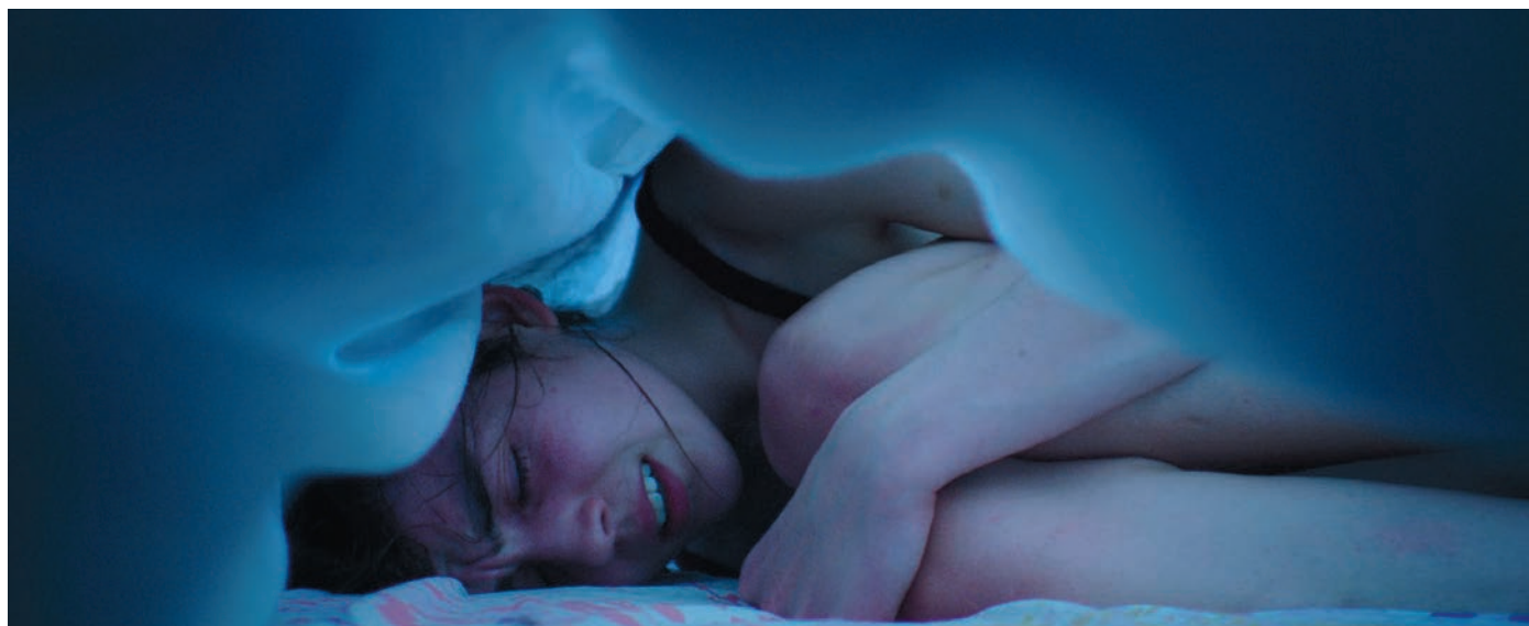
Grave de Julia Ducournau