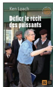
Défier le récit des puissants Ken Loach Éditions Indigènes Paris, 2014, 46 pages