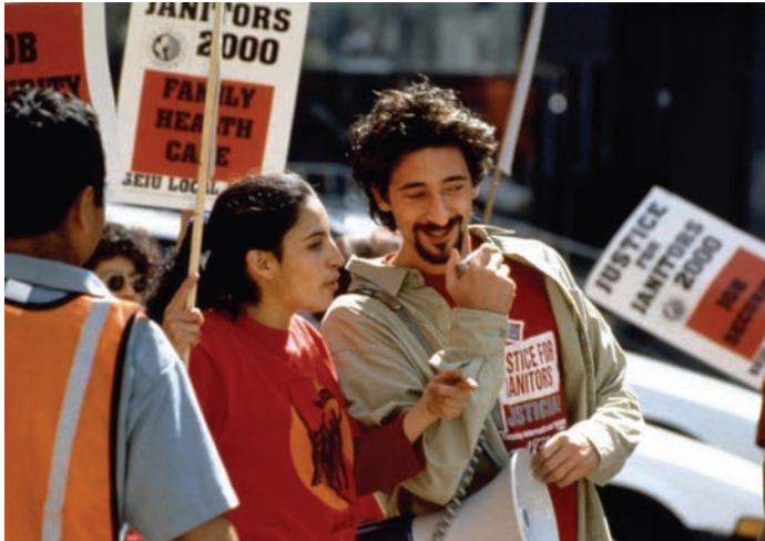
Bread and Roses