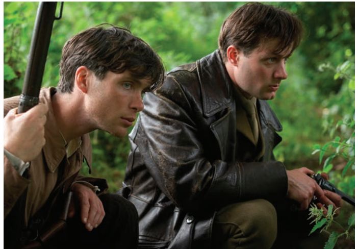
The Wind That Shake the Barley

images est d'amadouer le spectateur ou de lui procurer un repos, ou encore tout simplement de changer son univers. Cette esthétique du divertissement n'est pas seulement apolitique, elle est en réalité un adversaire de la politisation du cinéma. En second lieu, l'approche esthétique de Loach, que l'on a qualifiée de « réaliste », n'en est pas moins soucieuse de beauté formelle. L'esthétique réaliste de la résistance ne signifie en rien l'abolition du beau. Même dans ses films les plus durs ou les plus crus, Loach cherche à émouvoir. Si nous pouvons éprouver de la colère devant des scènes d'injustice, le cinéaste entend nous conduire plus loin, à dépasser celle-ci et à voir au-delà de la misère et de l'oppression. Dès lors, la beauté devient un outil pour défier les puissants.