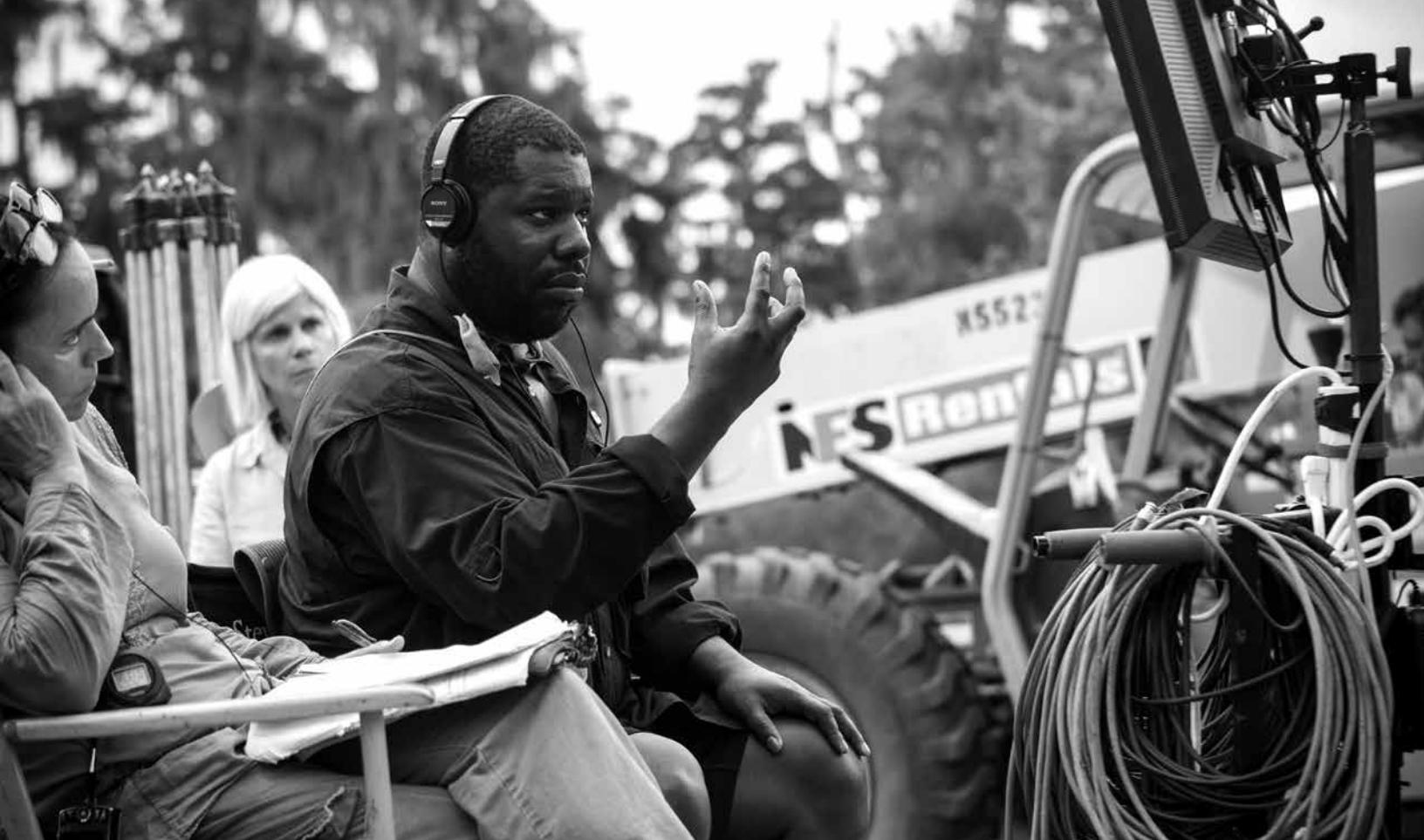
Steve McQueen sur le plateau de tournage de 12 Years a Slave

tient plus. Une des scènes les plus saisissantes de 12 Years a Slave est certainement celle où Solomon est vendu pour la première fois. Pas de vulgaire charrette sur une place de marché: la marchandise de Freeman l'esclavagiste (!) est exposée, nue, dans un chic salon. Il y a quelque chose de particulièrement atroce à contempler les Blancs endimanchés déambuler parmi ces hommes et ces femmes effarés. Finalement, la seule attache de Solomon à son ancienne vie restera son violon, dont il jouera dans les circonstances les plus terribles et dont il se séparera dans un grand moment de désespoir.