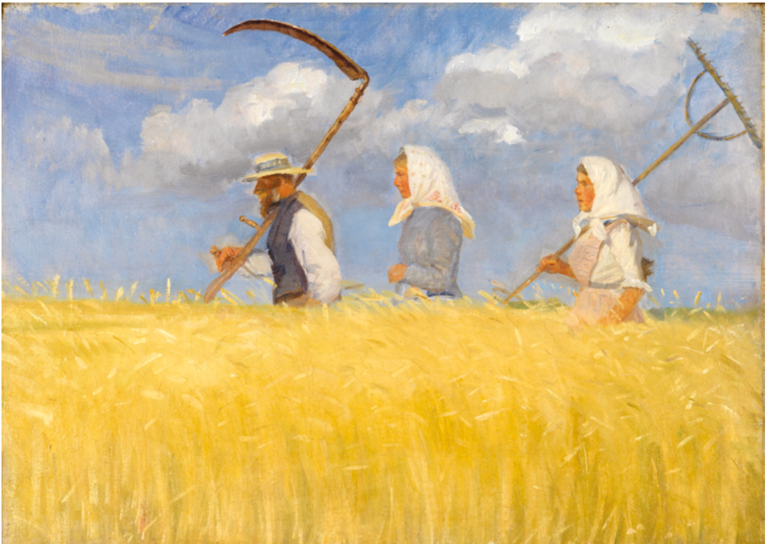
Harvesters . Peinture: Anna Ancher, 1905.