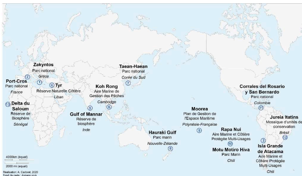
Figure 1. Localisation des études de cas.

sociétés diffèrent radicalement, soit de réactions contrastées à des situations comparables.