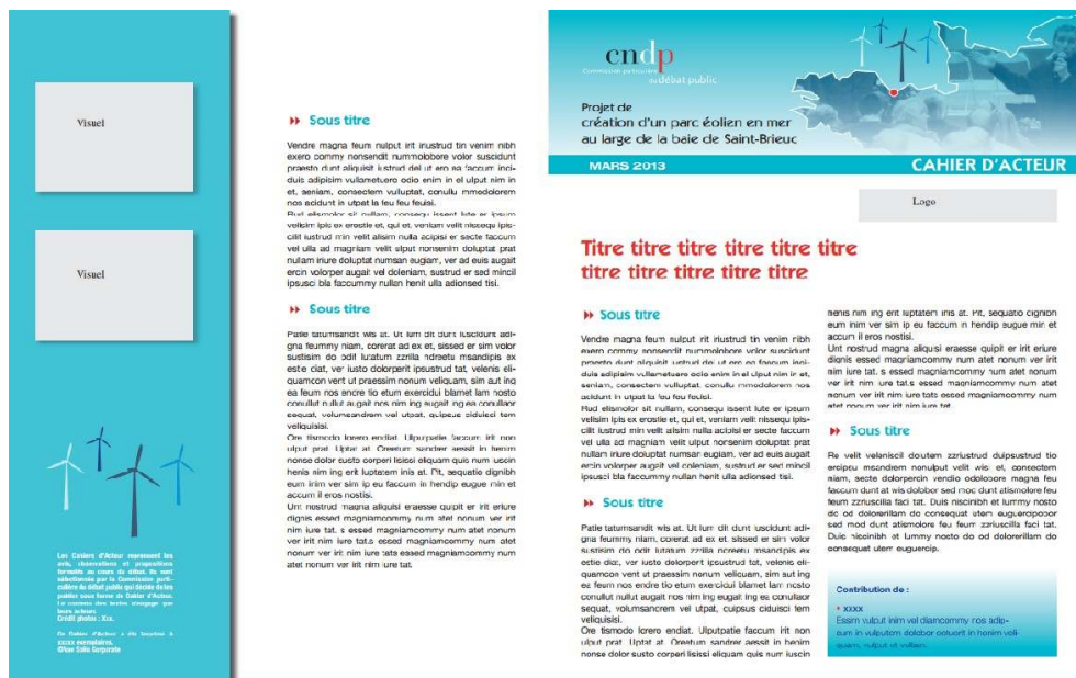
Figure 1. Maquette Cahier d'acteur.